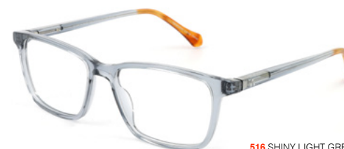
516 SHINY LIGHT GREY