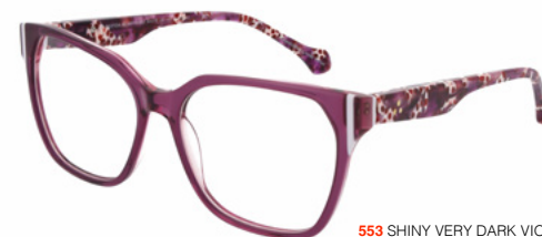
553 SHINY VERY DARK VIOLET