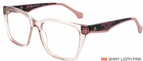
566 SHINY LIGHT PINK