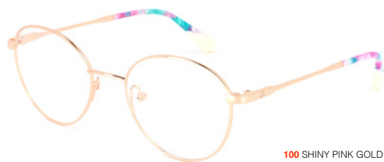
100 SHINY PINK GOLD