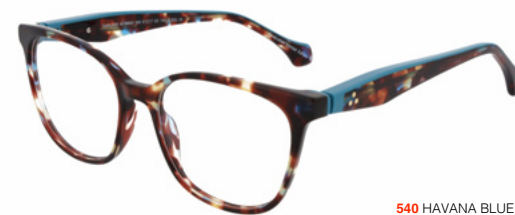
540 HAVANA BLUE