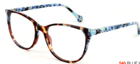
540 BLUE HAVANA