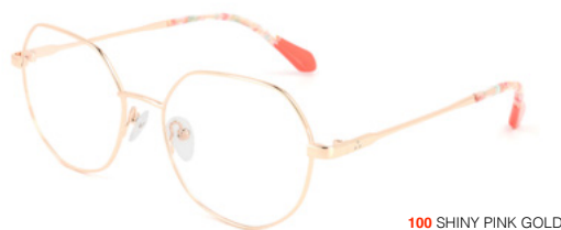
100 SHINY PINK GOLD