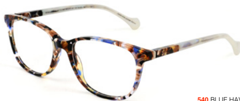
540 BLUE HAVANA