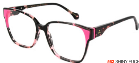
562 SHINY FUCHSIA