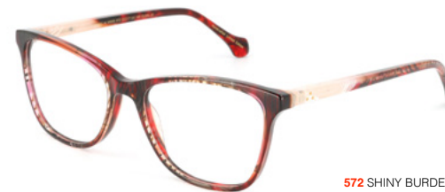
572 SHINY BURDEAUX