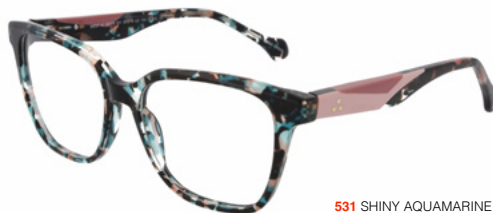
531 SHINY AQUAMARINE