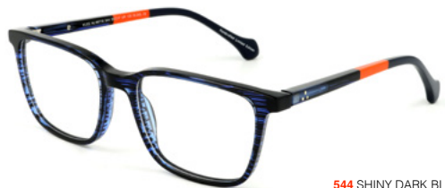
544 SHINY DARK BLUE