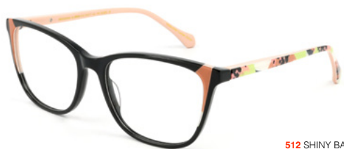
512 SHINY BACK