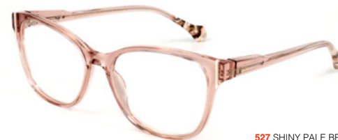
527 SHINY PALE BROWN