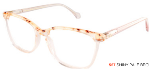
527 SHINY PALE BROWN