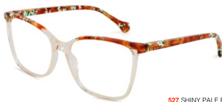
527 SHINY PALE BROWN