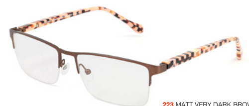
223 MATT VERY DARK BROWN