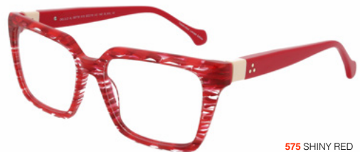
575 SHINY RED