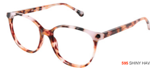
595 SHINY HAVANA