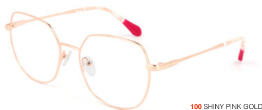
100 SHINY PINK GOLD