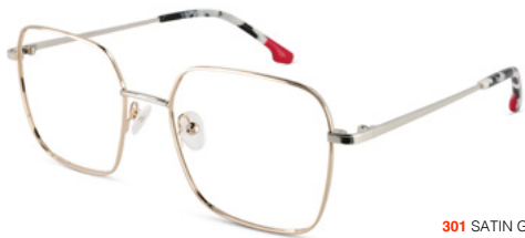
301 SATIN GOLD