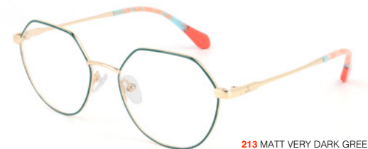
213 MATT VERY DARK GREEN