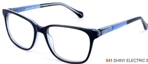
541 SHINY ELECTRIC BLUE