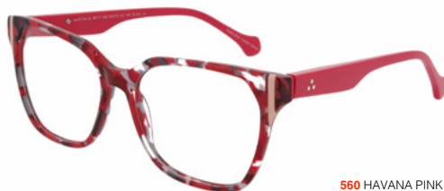
560 HAVANA PINK