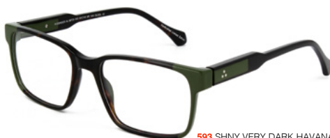
593 SHINY VERY DARK HAVANA