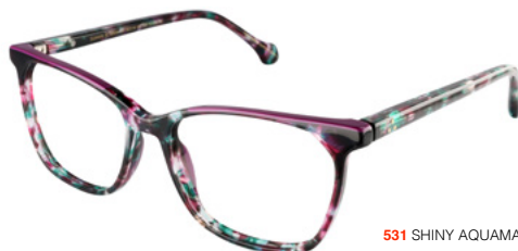
531 SHINY AQUAMARINE