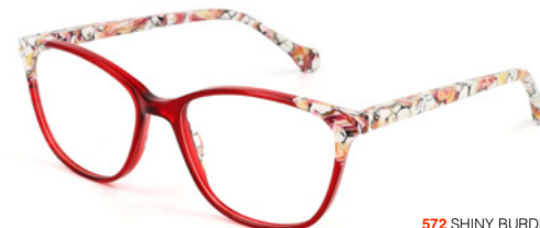
572 SHINY BURDEAUX