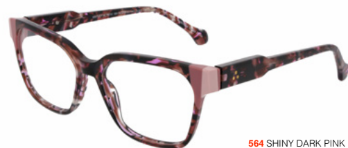
564 SHINY DARK PINK