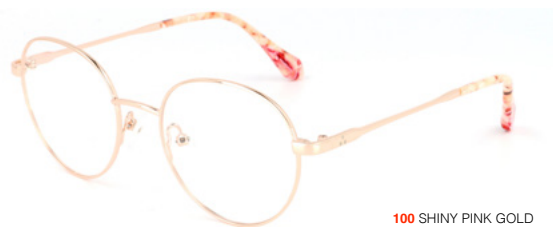
100 SHINY PINK GOLD