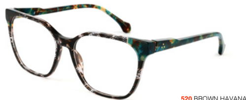
520 BROWN HAVANA