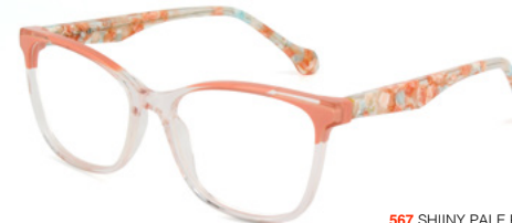
567 SHIINY PALE PINK