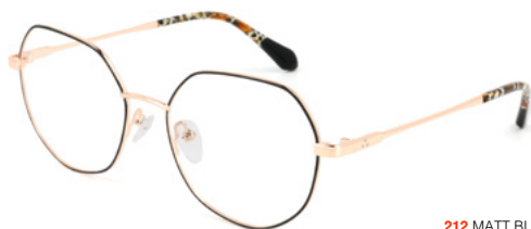
212 MATT BLACK