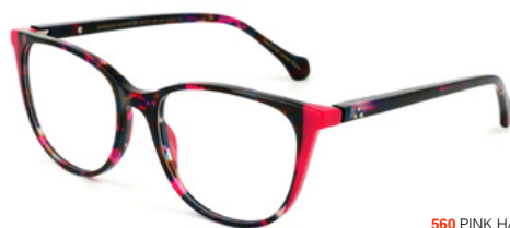
560 PINK HAVANA