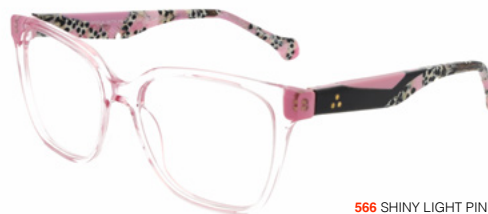
566 SHINY LIGHT PINK