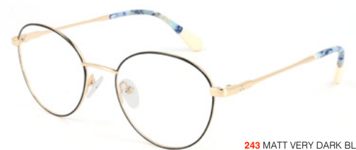
243 MATT VERY DARK BLUE