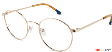
101 SHINY GOLD