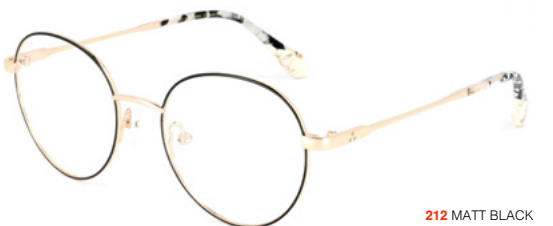
212 MATT BLACK