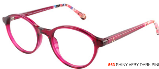
563 SHINY VERY DARK PINK