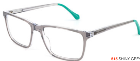
515 SHINY GREY