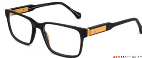
612 MATT BLACK