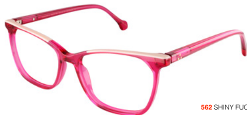
562 SHINY FUCSIA