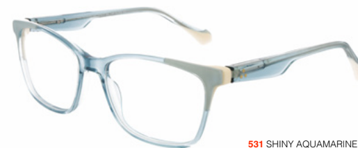
531 SHINY AQUAMARINE