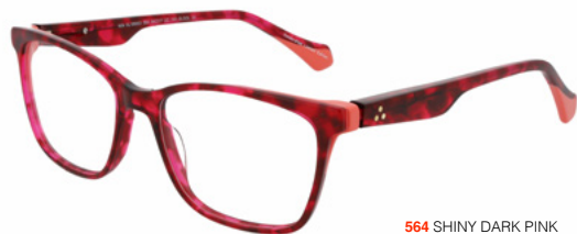
564 SHINY DARK PINK