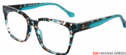
530 HAVANA GREEN