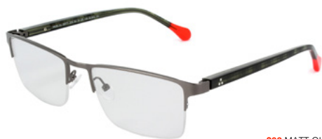
203 MATT GUN