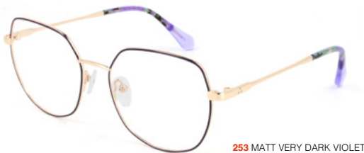
253 MATT VERY DARK VIOLET