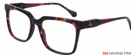
560 HAVANA PINK