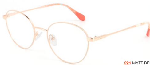
221 MATT BEIGE