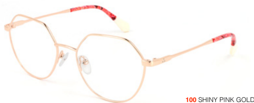
100 SHINY PINK GOLD