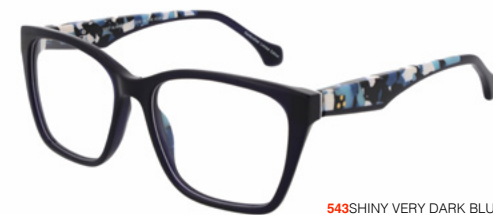
543 SHINY VERY DARK BLUE