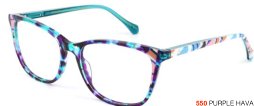
550 PURPLE HAVANA