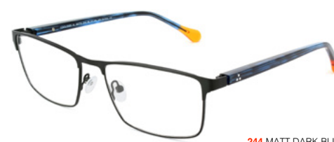
244 MATT DARK BLUE