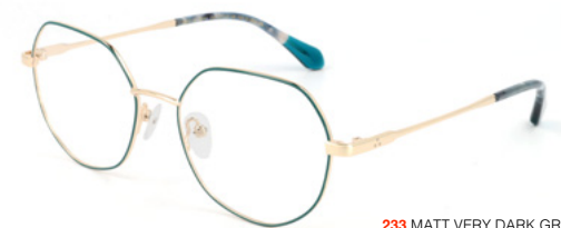
233 MATT VERY DARK GREEN