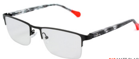
212 MATT BLACK