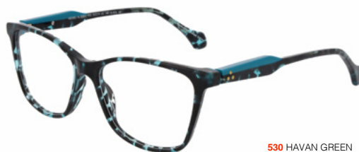
530 HAVAN GREEN