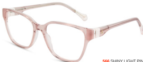
566 SHINY LIGHT PINK