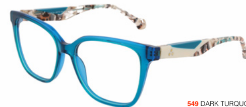
549 DARK TURQUOISE