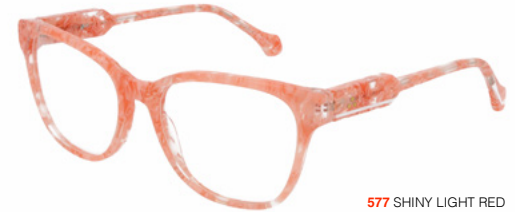
577 SHINY LIGHT RED