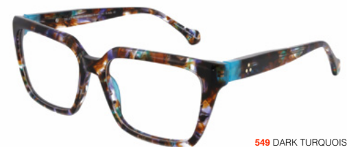
549 DARK TURQUOISE