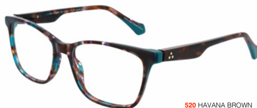
520 HAVANA BROWN