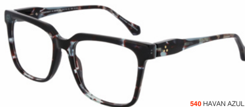
540 HAVAN AZUL