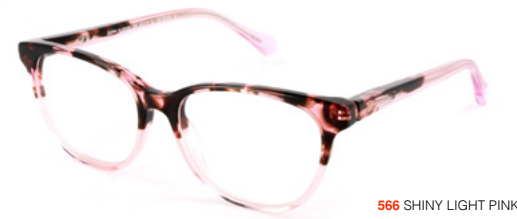
566 SHINY LIGHT PINK