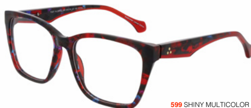
599 SHINY MULTICOLOR