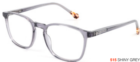
515 SHINY GREY