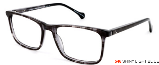
546 SHINY LIGHT BLUE