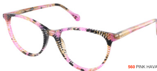
560 PINK HAVANA