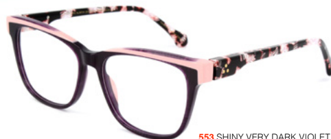
553 SHINY VERY DARK VIOLET