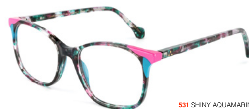
531 SHINY AQUAMARINE