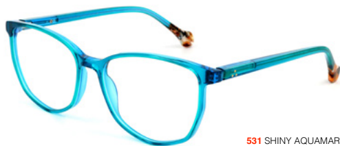
531 SHINY AQUAMARINE