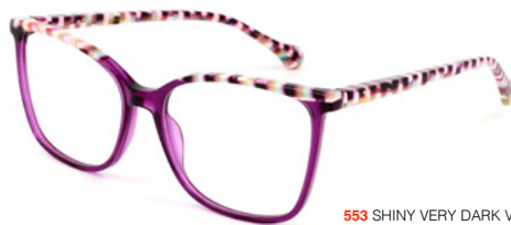
553 SHINY VERY DARK VIOLET