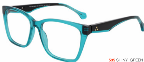
535 SHINY GREEN