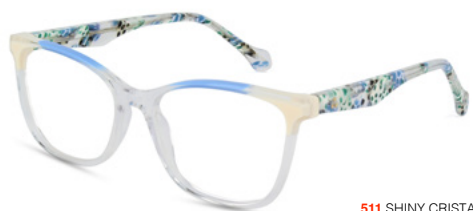
511 SHINY CRISTAL