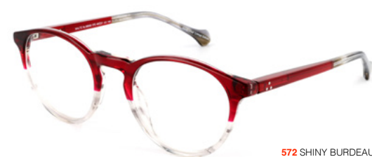
572 SHINY BURDEAUX