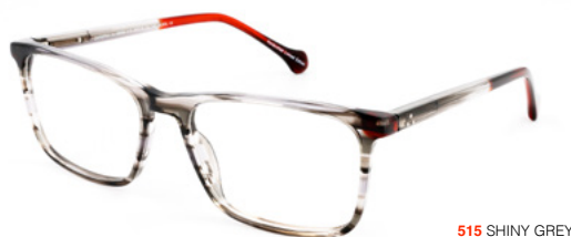
515 SHINY GREY