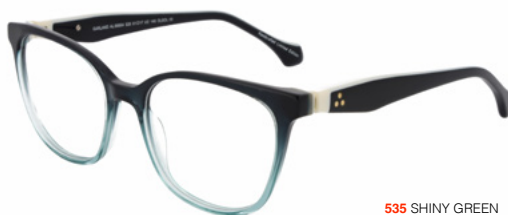
535 SHINY GREEN