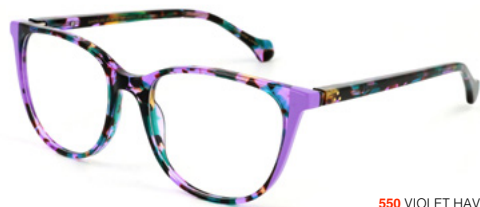
550 VIOLET HAVANA