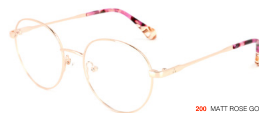
200 MATT ROSE GOLD