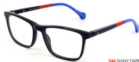
544 SHINY DARK BLUE