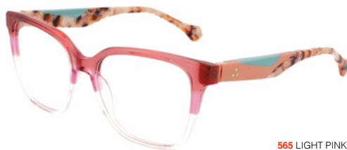
565 LIGHT PINK