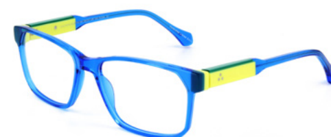
541 SHINY ELECTRIC BLUE