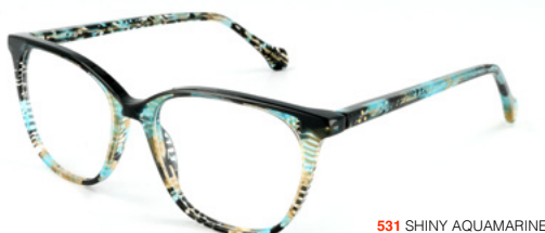
531 SHINY AQUAMARINE