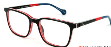
543 SHINY VERY DARK BLUE