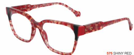
575 SHINY RED