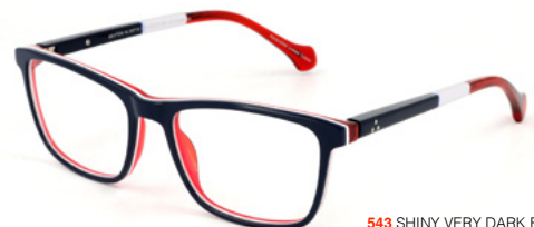
543 SHINY VERY DARK BLUE