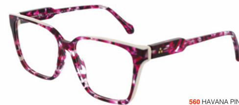
560 HAVANA PINK