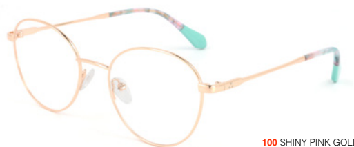
100 SHINY PINK GOLD