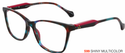
599 SHINY MULTICOLOR