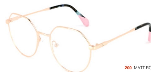
200 MATT ROSE GOLD