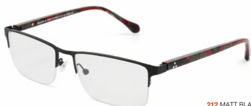
212 MATT BLACK