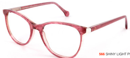
566 SHINY LIGHT PINK