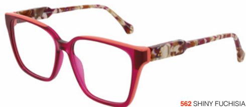
562 SHINY FUCHSIA