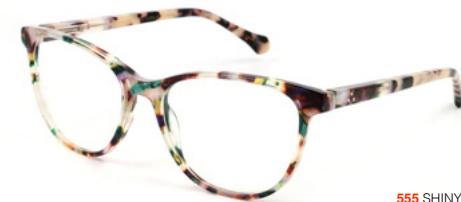
555 SHINY VIOLET