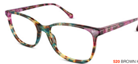
520 BROWN HAVANA