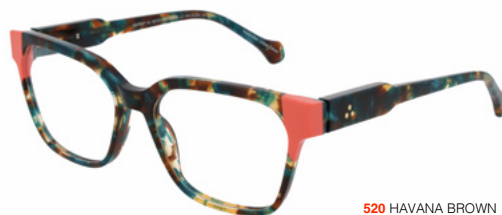
520 HAVANA BROWN