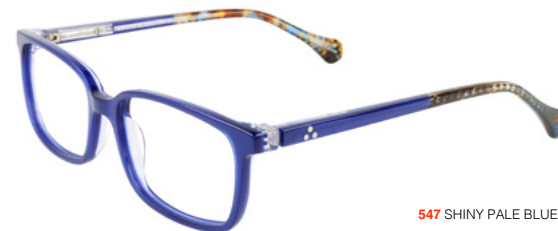
547 SHINY PALE BLUE