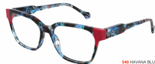
540 HAVANA BLUE