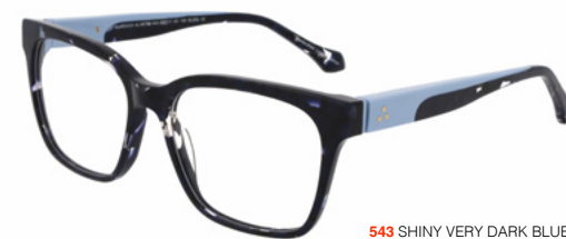
543 SHINY VERY DARK BLUE