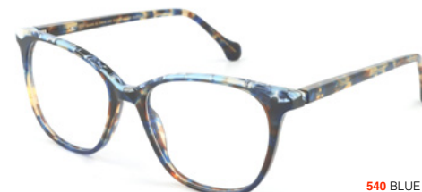
540 BLUE HAVANA