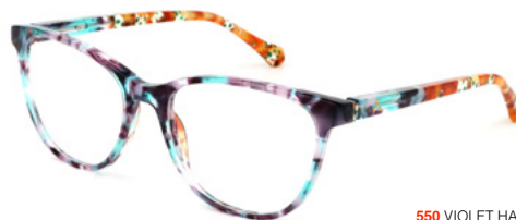
550 VIOLET HAVANA