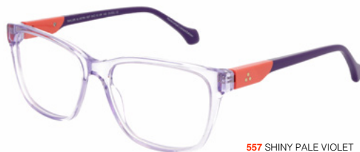
557 SHINY PALE VIOLET