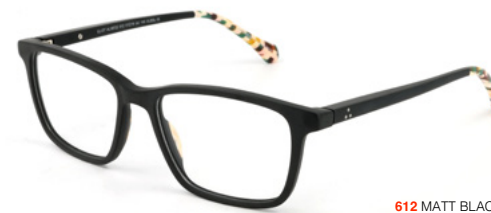
612 MATT BLACK