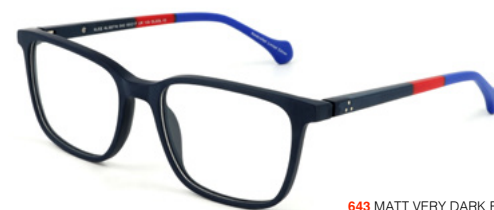
643 MATT VERY DARK BLUE