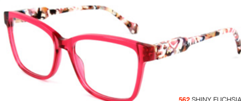
562 SHINY FUCHSIA