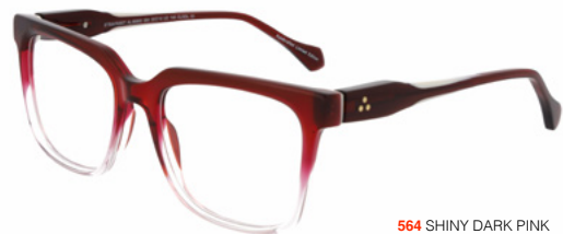
564 SHINY DARK PINK