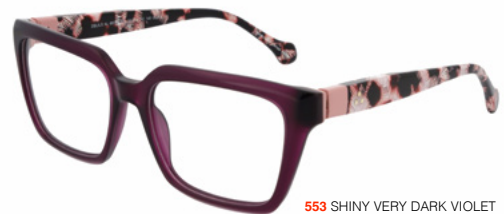
553 SHINY VERY DARK VIOLET