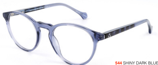
544 SHINY DARK BLUE