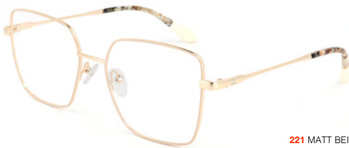
221 MATT BEIGE