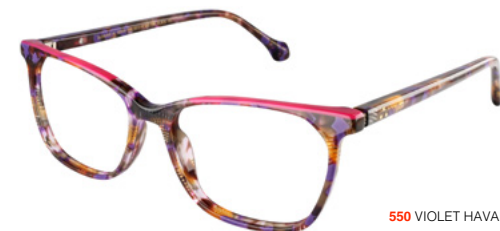
550 VIOLET HAVANA