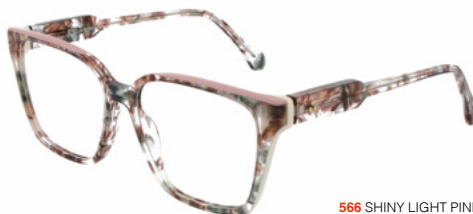
566 SHINY LIGHT PINK