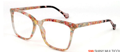
599 SHINY MULTICOLOR