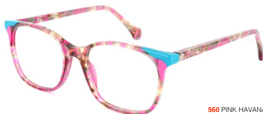
560 PINK HAVANA