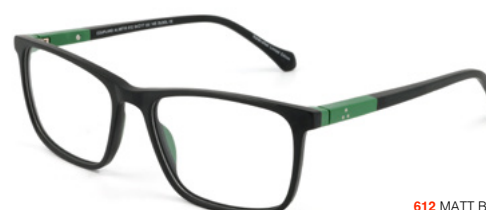
612 MATT BLACK