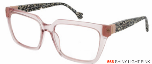
566 SHINY LIGHT PINK