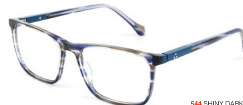
544 SHINY DARK BLUE