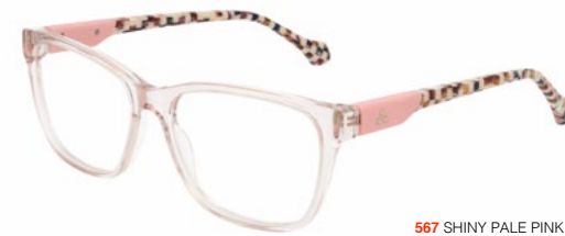
567 SHINY PALE PINK