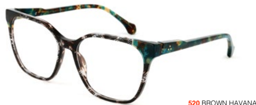
520 BROWN HAVANA