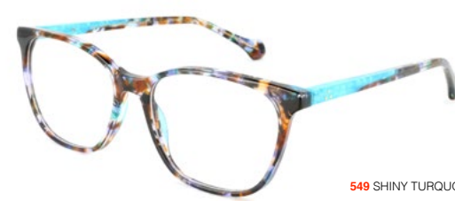
549 SHINY TURQUOISE