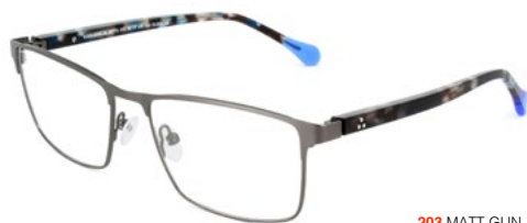
203 MATT GUN