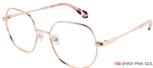
100 SHINY PINK GOLD