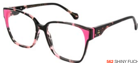
562 SHINY FUCHSIA