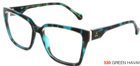
530 GREEN HAVANA