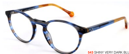
543 SHINY VERY DARK BLUE