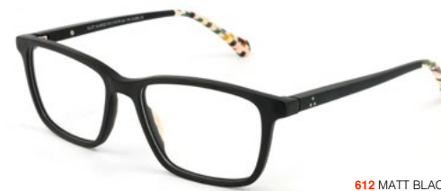
612 MATT BLACK