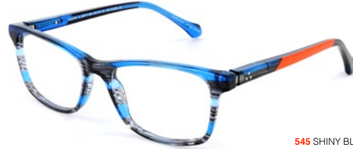
545 SHINY BLUE