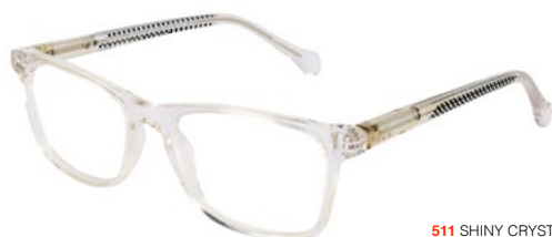
511 SHINY CRYSTAL