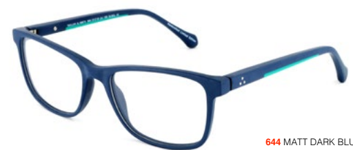
644 MATT DARK BLUE