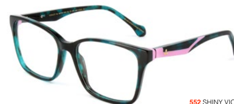
552 SHINY VIOLET