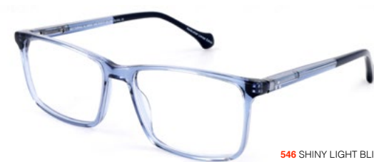
546 SHINY LIGHT BLUE