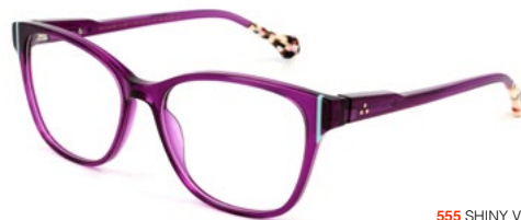
555 SHINY VIOLET