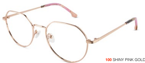
100 SHINY PINK GOLD