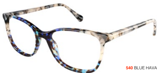
540 BLUE HAVANA