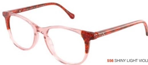
556 SHINY LIGHT VIOLET