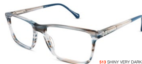
513 SHINY VERY DARK GREY