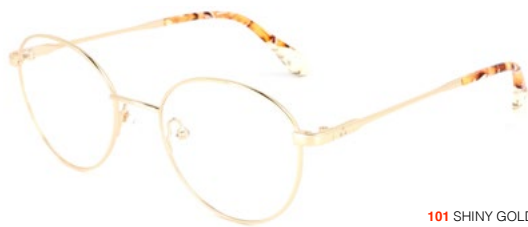
101 SHINY GOLD