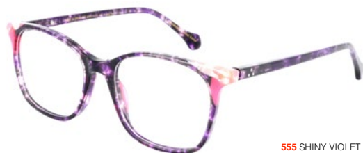
555 SHINY VIOLET