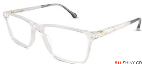
511 SHINY CRYSTAL