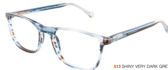
513 SHINY VERY DARK GREY