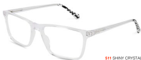
511 SHINY CRYSTAL