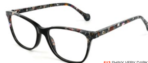
513 SHINY VERY DARK GREY