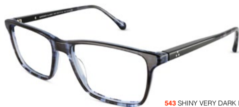
543 SHINY VERY DARK BLUE