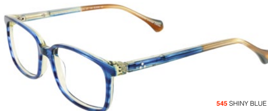
545 SHINY BLUE