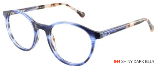
544 SHINY DARK BLUE