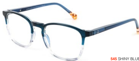
545 SHINY BLUE