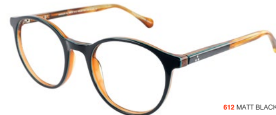
612 MATT BLACK