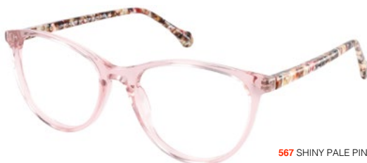
567 SHINY PALE PINK