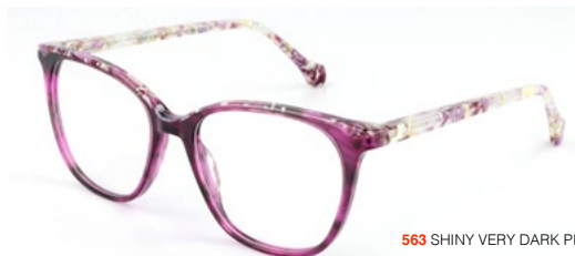
563 SHINY VERY DARK PINK