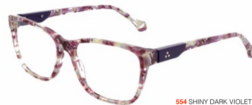
554 SHINY DARK VIOLET