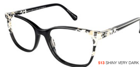
513 SHINY VERY DARK GREY