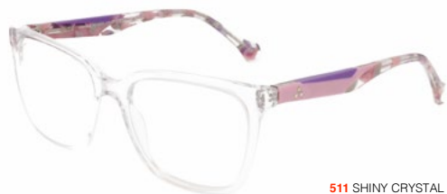
511 SHINY CRYSTAL