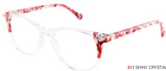
511 SHINY CRYSTAL