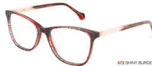
572 SHINY BURDEAUX