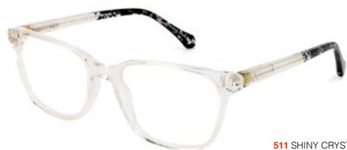
511 SHINY CRYSTAL