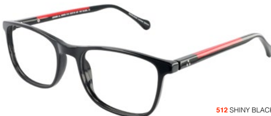
512 SHINY BLACK