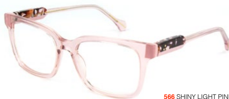
566 SHINY LIGHT PINK