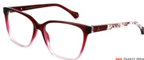
565 SHINY PINK