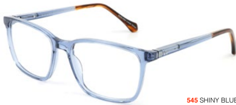
545 SHINY BLUE