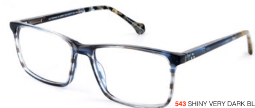
543 SHINY VERY DARK BLUE