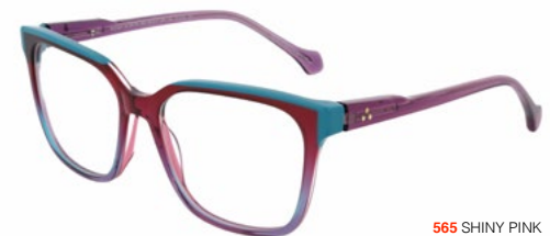
565 SHINY PINK