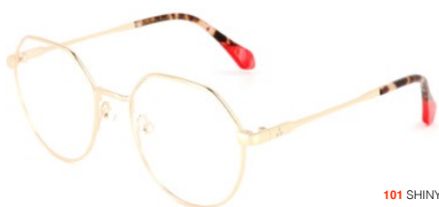
101 SHINY GOLD