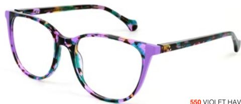
550 VIOLET HAVANA