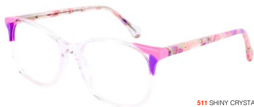
511 SHINY CRYSTAL