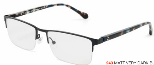
243 MATT VERY DARK BLUE