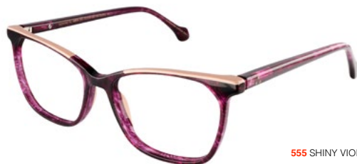
555 SHINY VIOLET