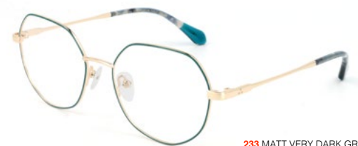
233 MATT VERY DARK GREEN