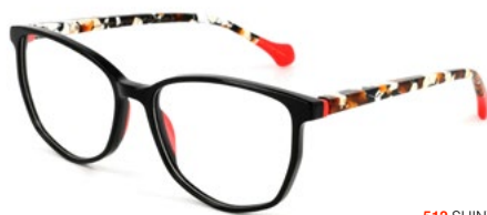
512 SHINY BLACK