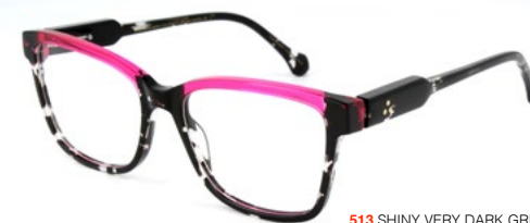
513 SHINY VERY DARK GREY