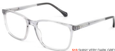
513 SHINY VERY DARK GREY