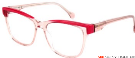
566 SHINY LIGHT PINK