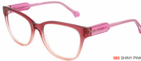
565 SHINY PINK