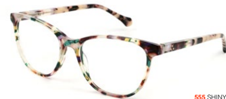
555 SHINY VIOLET