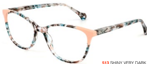
513 SHINY VERY DARK GREY