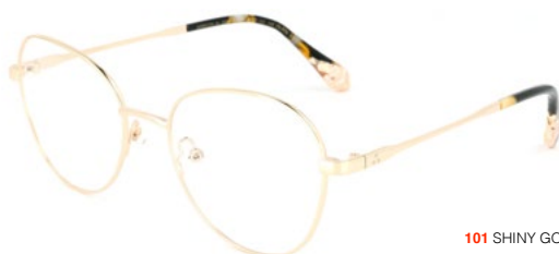
101 SHINY GOLD