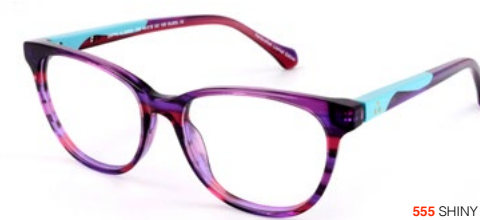
555 SHINY VIOLET