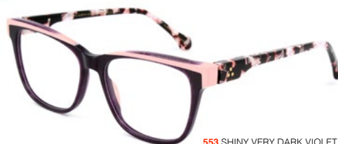
553 SHINY VERY DARK VIOLET