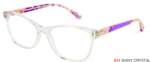
511 SHINY CRYSTAL