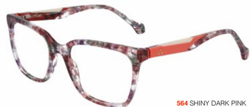
564 SHINY DARK PINK