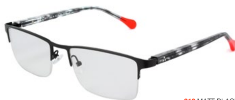
212 MATT BLACK