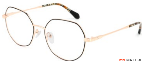
212 MATT BLACK