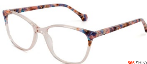
565 SHINY PINK