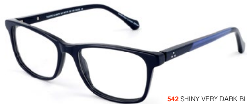
542 SHINY VERY DARK BLUE