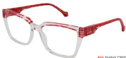
511 SHINY CRISTAL