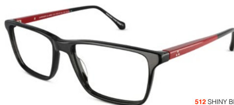
512 SHINY BLACK