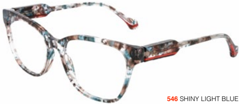
546 SHINY LIGHT BLUE