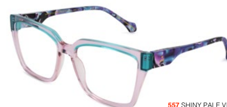
557 SHINY PALE VIOLET