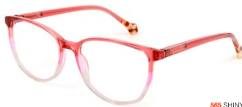
565 SHINY PINK