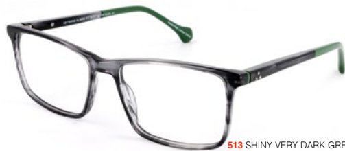
513 SHINY VERY DARK GREEN