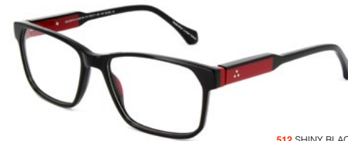
512 SHINY BLACK