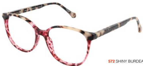
572 SHINY BURDEAUX