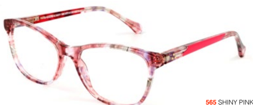
565 SHINY PINK