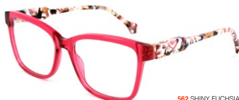
562 SHINY FUCHSIA