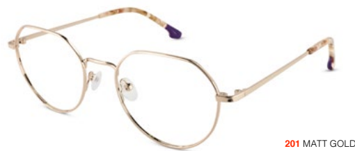
201 MATT GOLD