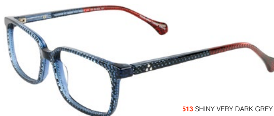
513 SHINY VERY DARK GREY