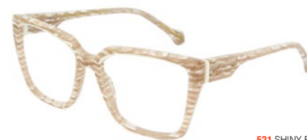
521 SHINY BEIGE