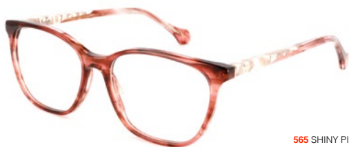
565 SHINY PINK