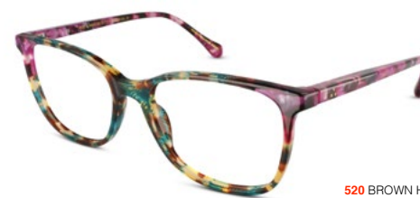
520 BROWN HAVANA