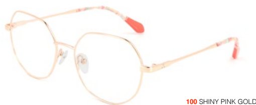
100 SHINY PINK GOLD