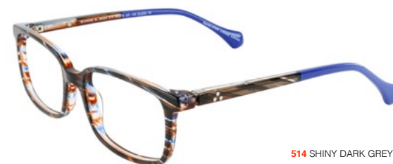
514 SHINY DARK GREY