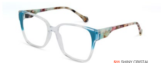
511 SHINY CRISTAL