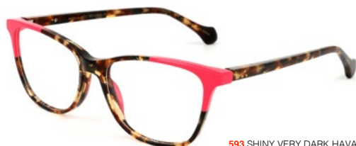
593 SHINY VERY DARK HAVANA