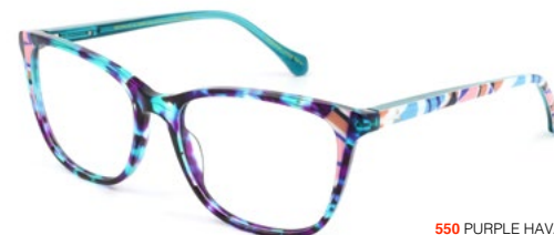
550 PURPLE HAVANA