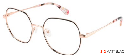
212 MATT BLACK