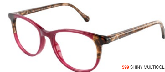
599 SHINY MULTICOLOR