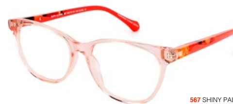
567 SHINY PALE PINK