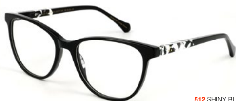
512 SHINY BLACK