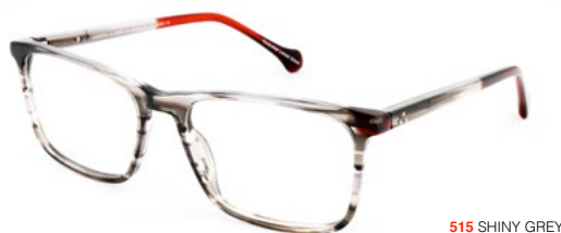
515 SHINY GREY