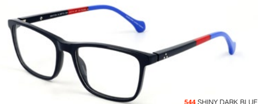
544 SHINY DARK BLUE