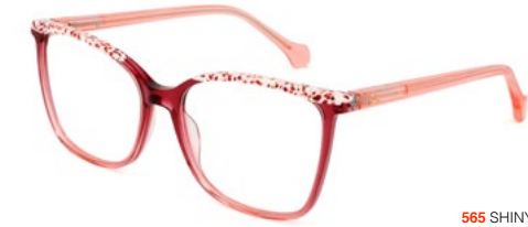
565 SHINY PINK