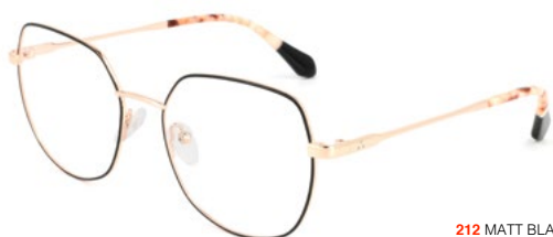
212 MATT BLACK