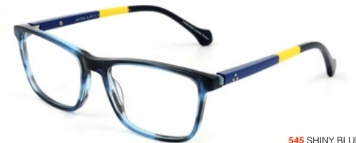
545 SHINY BLUE