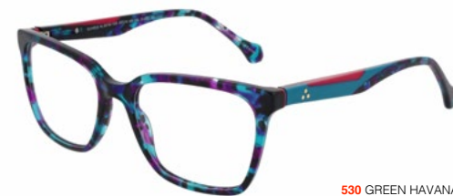
530 GREEN HAVANA