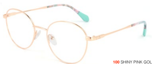
100 SHINY PINK GOLD