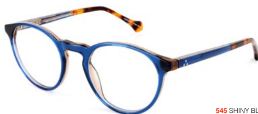
545 SHINY BLUE