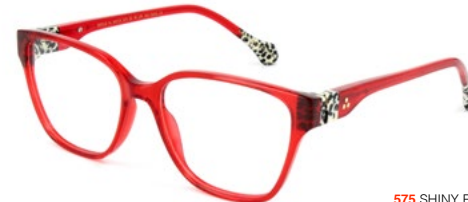
575 SHINY RED