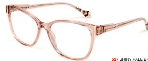
527 SHINY PALE BROWN