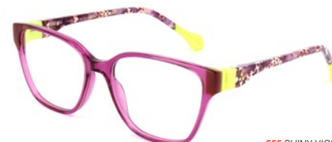
555 SHINY VIOLET