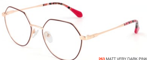
263 MATT VERY DARK PINK