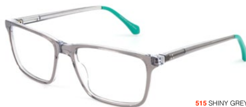
515 SHINY GREY