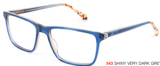
543 SHINY VERY DARK GREY