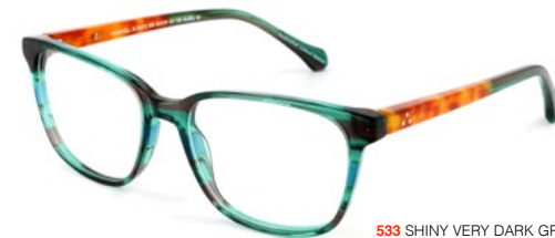
533 SHINY VERY DARK GREEN