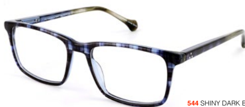
544 SHINY DARK BLUE