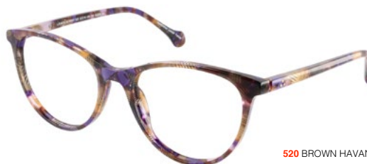
520 BROWN HAVANA