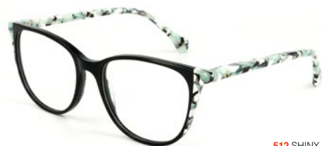
512 SHINY BLACK