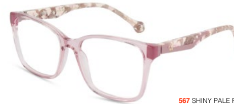
567 SHINY PALE PINK