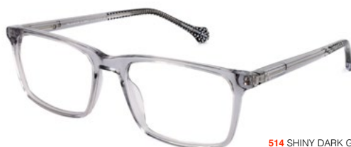
514 SHINY DARK GREY