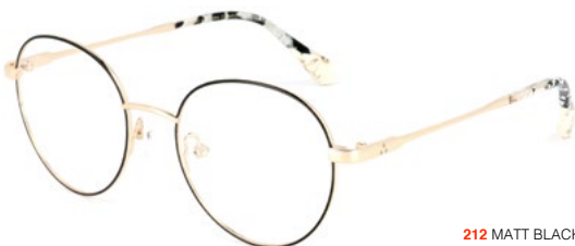
212 MATT BLACK