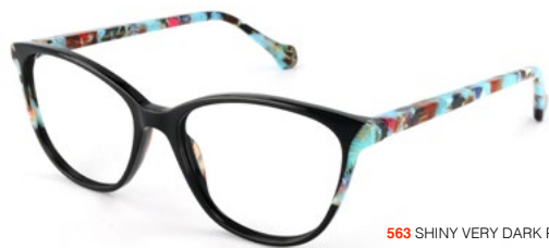
563 SHINY VERY DARK PINK