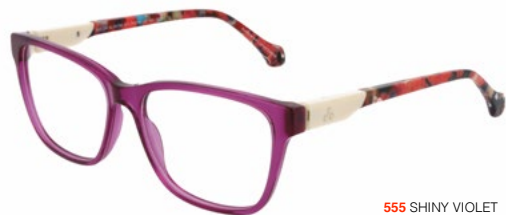
555 SHINY VIOLET