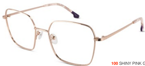
100 SHINY PINK GOLD