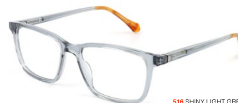
516 SHINY LIGHT GREY