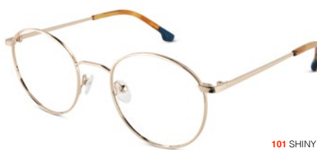
101 SHINY GOLD