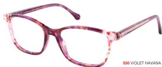
550 VIOLET HAVANA