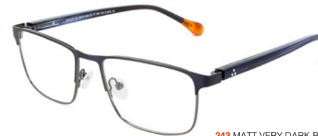
243 MATT VERY DARK BLUE