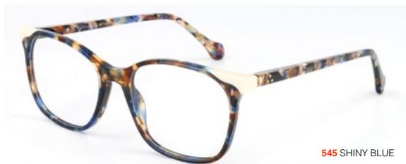
545 SHINY BLUE