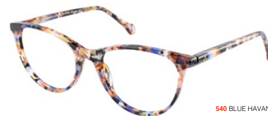
540 BLUE HAVANA