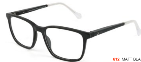
612 MATT BLACK