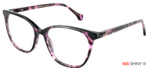
555 SHINY VIOLET