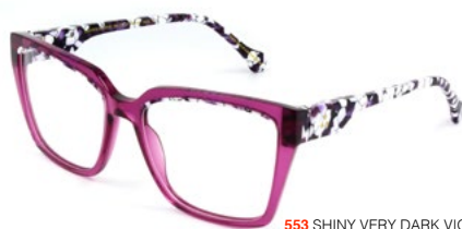
553 SHINY VERY DARK VIOLET