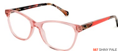
567 SHINY PALE PINK