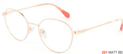
221 MATT BEIGE