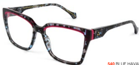
540 BLUE HAVANA