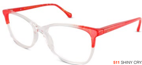
511 SHINY CRYSTAL