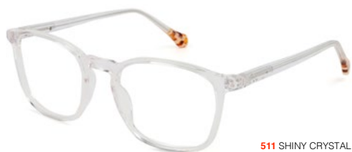
511 SHINY CRYSTAL