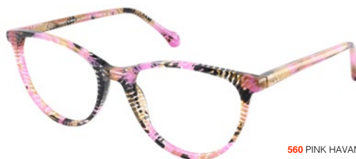
560 PINK HAVANA