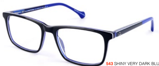
543 SHINY VERY DARK BLUE