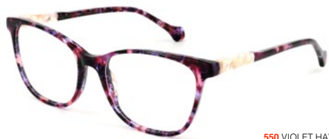
550 VIOLET HAVANA