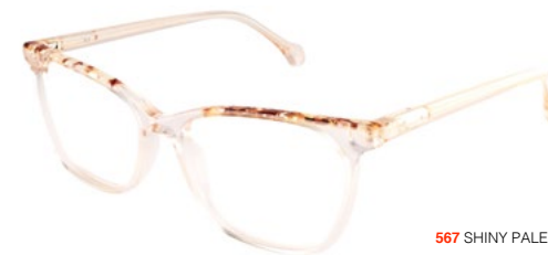
567 SHINY PALE PINK