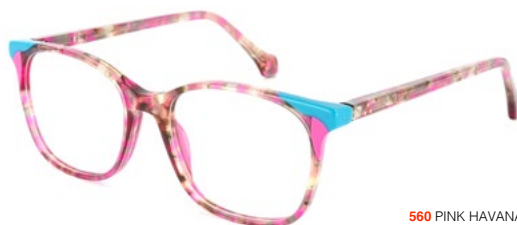
560 PINK HAVANA