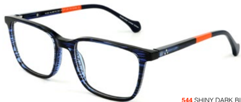
544 SHINY DARK BLUE