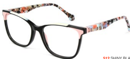
512 SHINY BLACK