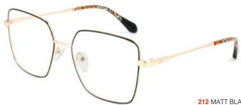
212 MATT BLACK