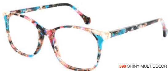
599 SHINY MULTICOLOR