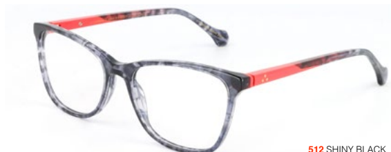
512 SHINY BLACK