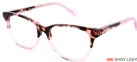
566 SHINY LIGHT PINK