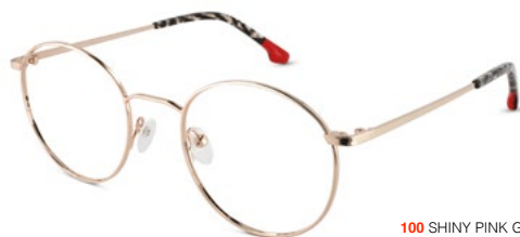
100 SHINY PINK GOLD