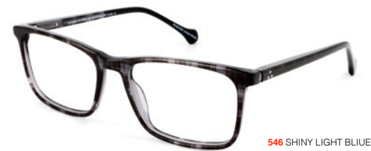
546 SHINY LIGHT BLUE