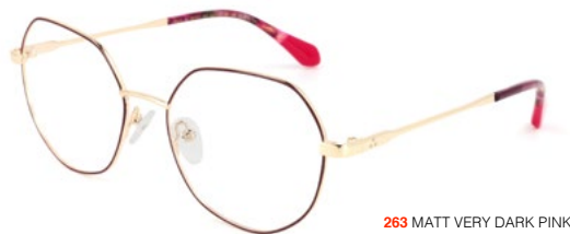
263 MATT VERY DARK PINK