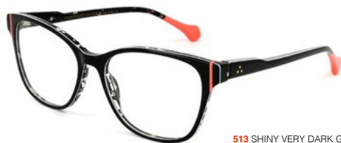
513 SHINY VERY DARK GREY