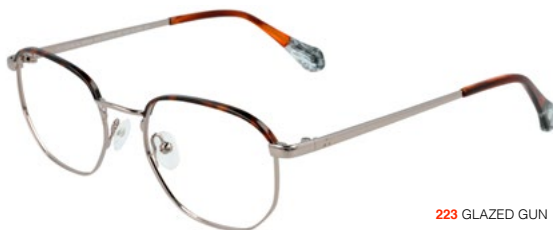
223 GLAZED GUN