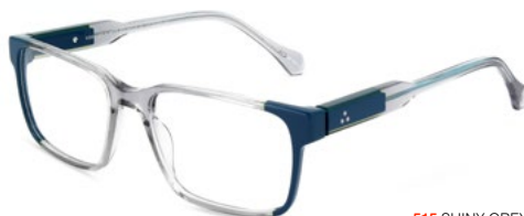
515 SHINY GREY