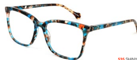
535 SHINY GREEN