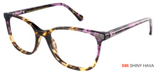
595 SHINY HAVANA