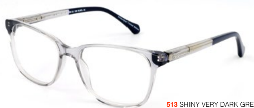
513 SHINY VERY DARK GREY