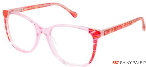
567 SHINY PALE PINK