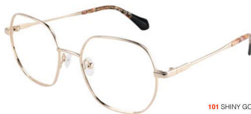
101 SHINY GOLD