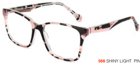
566 SHINY LIGHT PINK