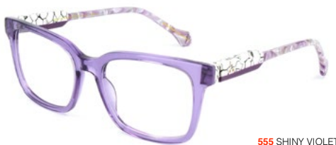
555 SHINY VIOLET