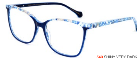
543 SHINY VERY DARK BLUE