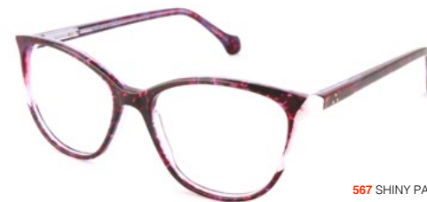
567 SHINY PALE PINK