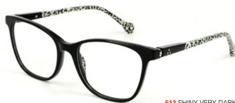
513 SHINY VERY DARK GREY