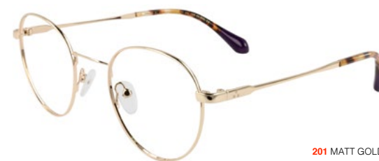
201 MATT GOLD