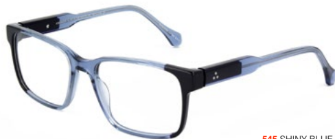
545 SHINY BLUE