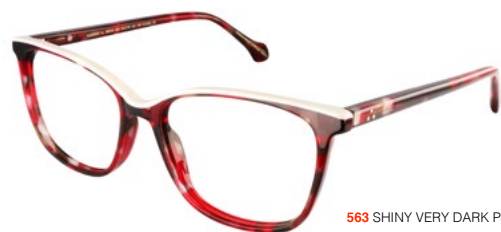
563 SHINY VERY DARK PINK