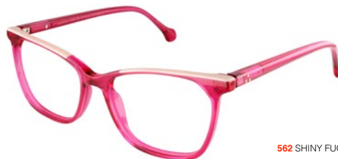
562 SHINY FUCHSIA