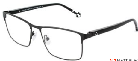
212 MATT BLACK