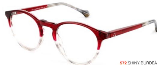
572 SHINY BURDEAUX