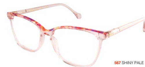
567 SHINY PALE PINK