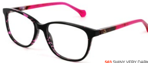
563 SHINY VERY DARK PINK