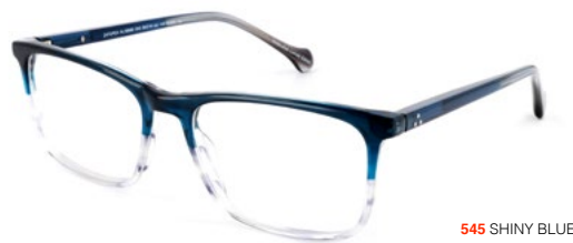
545 SHINY BLUE