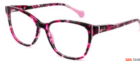
565 SHINY PINK