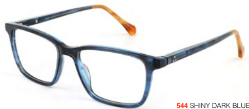
544 SHINY DARK BLUE