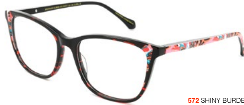
572 SHINY BURDEAUX