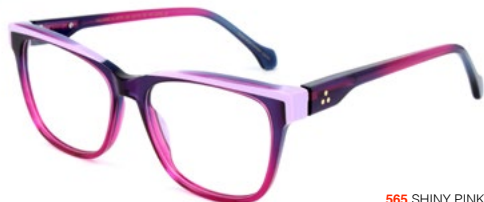
565 SHINY PINK