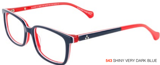
543 SHINY VERY DARK BLUE