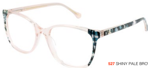
527 SHINY PALE BROWN