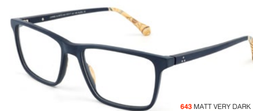
643 MATT VERY DARK BLUE