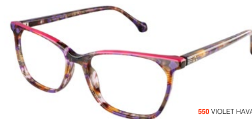
550 VIOLET HAVANA