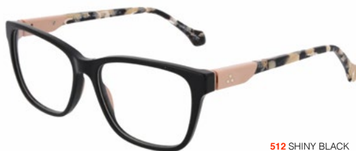
512 SHINY BLACK