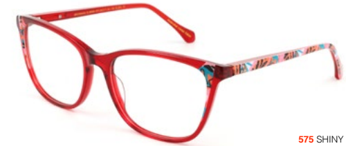
575 SHINY RED