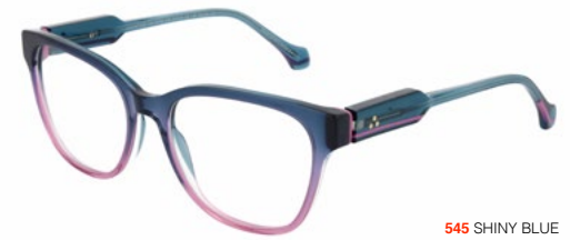
545 SHINY BLUE