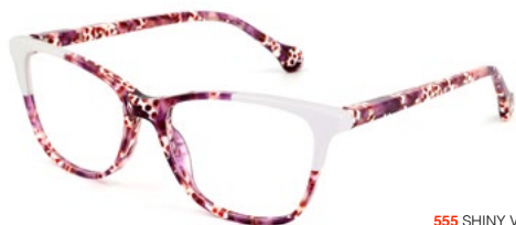
555 SHINY VIOLET