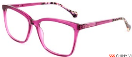
555 SHINY VIOLET