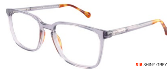
515 SHINY GREY