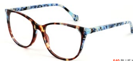
540 BLUE HAVANA