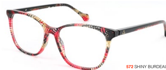
572 SHINY BURDEAUX