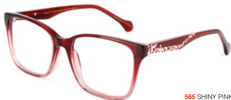
565 SHINY PINK