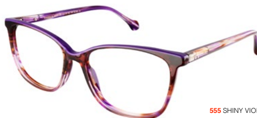
555 SHINY VIOLET