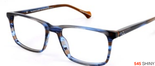
545 SHINY BLUE