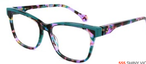
555 SHINY VIOLET