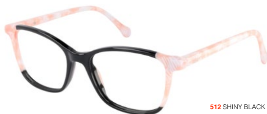
512 SHINY BLACK