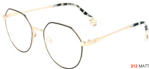
212 MATT BLACK