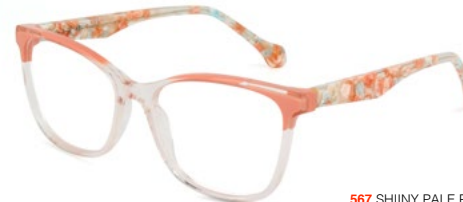
567 SHIINY PALE PINK