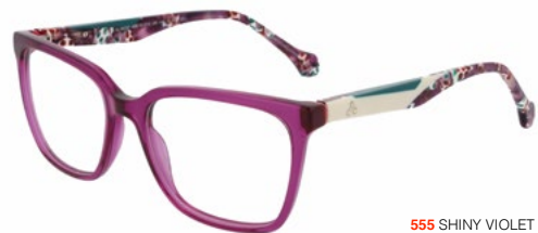
555 SHINY VIOLET