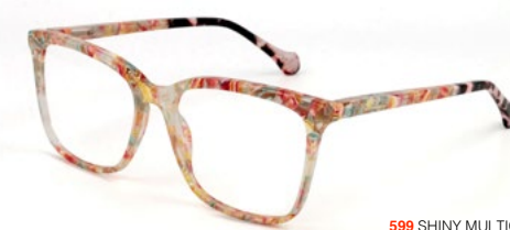
599 SHINY MULTICOLOR