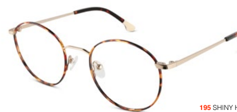
195 SHINY HAVANA