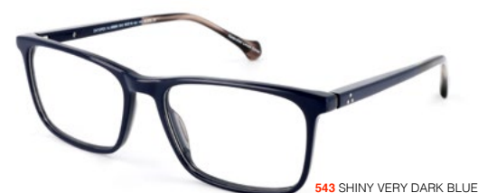
543 SHINY VERY DARK BLUE