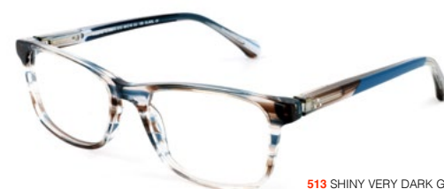
513 SHINY VERY DARK GREY