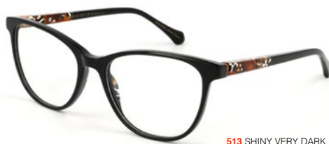
513 SHINY VERY DARK GREY