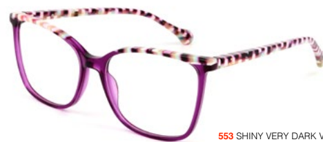
553 SHINY VERY DARK VIOLET