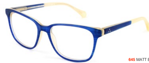
645 MATT BLUE