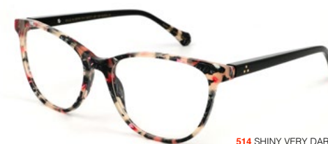
514 SHINY VERY DARK GREY