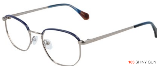
103 SHINY GUN