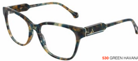
530 GREEN HAVANA