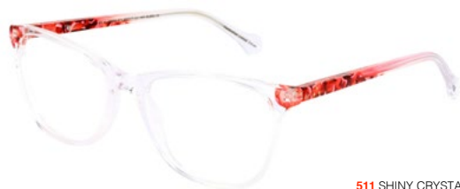
511 SHINY CRYSTAL