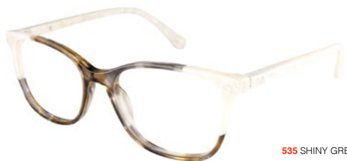
535 SHINY GREEN