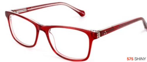
575 SHINY RED