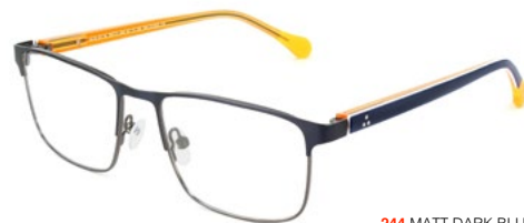
244 MATT DARK BLUE