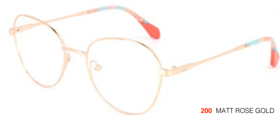
200 MATT ROSE GOLD