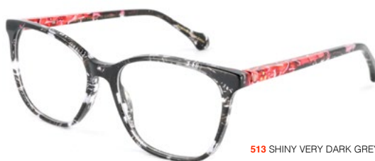
513 SHINY VERY DARK GREY