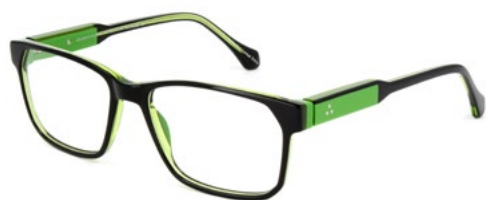
513 SHINY VERY DARK GREY