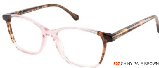
527 SHINY PALE BROWN