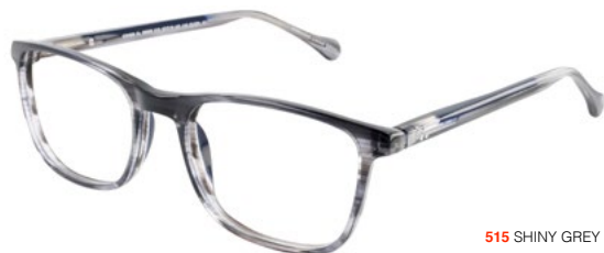
515 SHINY GREY