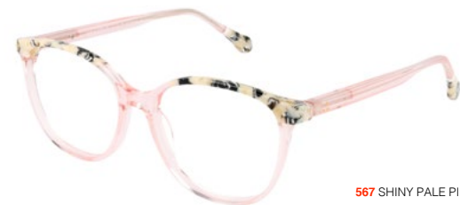
567 SHINY PALE PINK