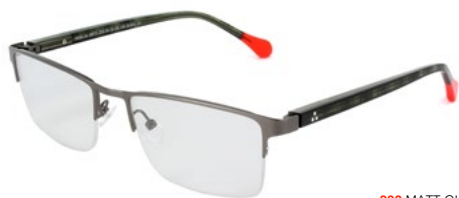
203 MATT GUN