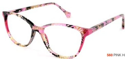
560 PINK HAVANA