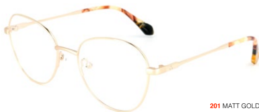
201 MATT GOLD