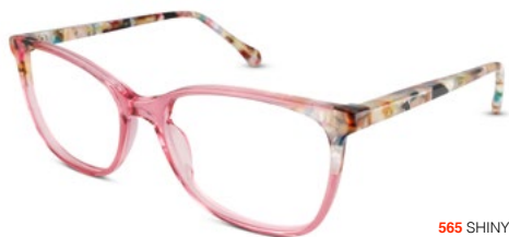
565 SHINY PINK