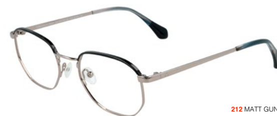
212 MATT GUN