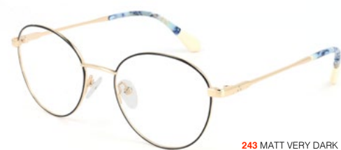
243 MATT VERY DARK BLUE