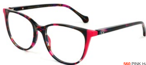
560 PINK HAVANA