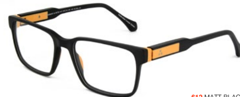
612 MATT BLACK