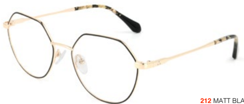
212 MATT BLACK