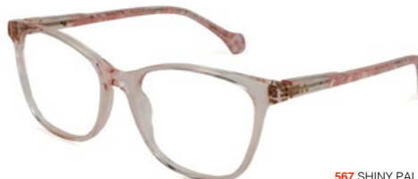
567 SHINY PALE PINK