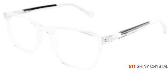
511 SHINY CRYSTAL