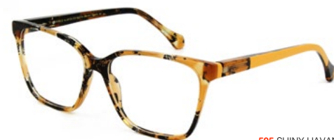
595 SHINY HAVANA