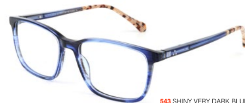
543 SHINY VERY DARK BLUE