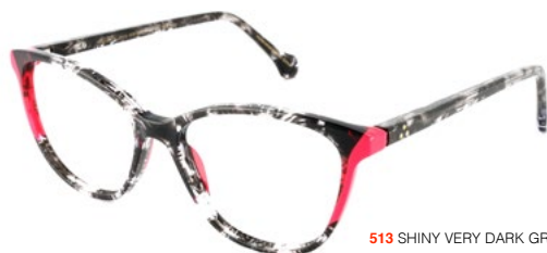
513 SHINY VERY DARK GREEN