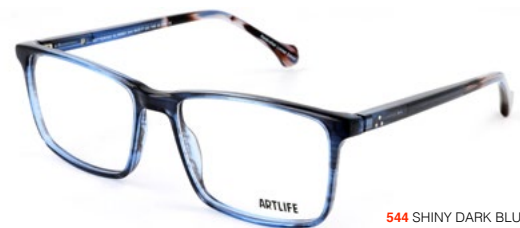
544 SHINY DARK BLUE