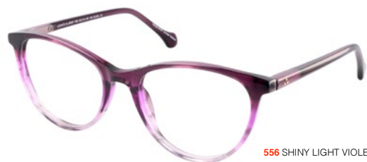
556 SHINY LIGHT VIOLET