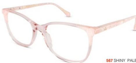
567 SHINY PALE PINK