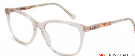
587 SHINY PALE ORANGE