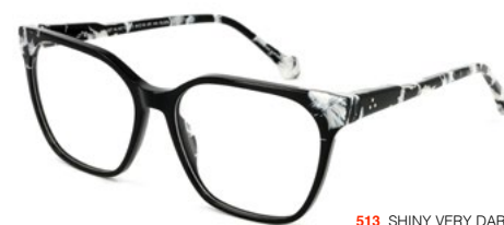
513 SHINY VERY DARK GREY