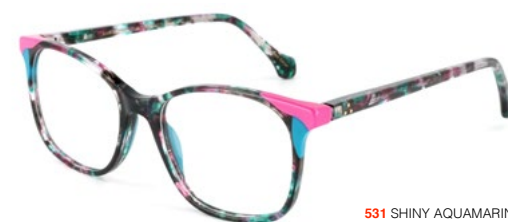
531 SHINY AQUAMARINE