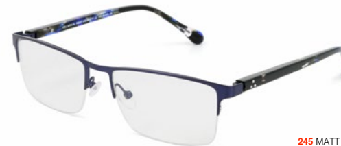
245 MATT BLUE