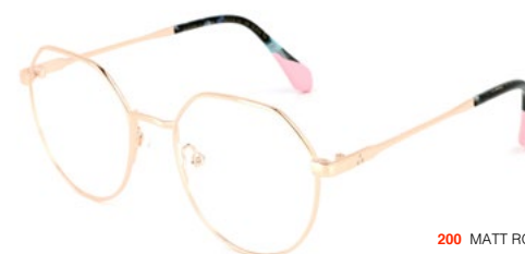
200 MATT ROSE GOLD