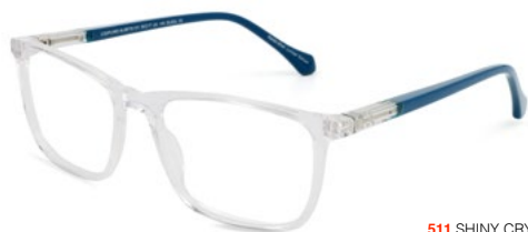
511 SHINY CRYSTAL