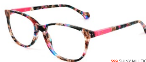
599 SHINY MULTICOLOR