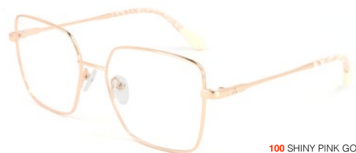
100 SHINY PINK GOLD