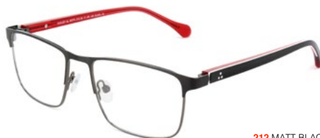
212 MATT BLACK