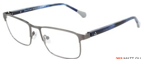
203 MATT GUN