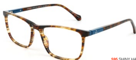
595 SHINY HAVANA