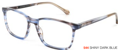
544 SHINY DARK BLUE