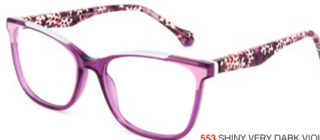
553 SHINY VERY DARK VIOLET