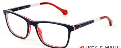
543 SHINY VERY DARK BLUE