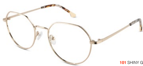
101 SHINY GOLD