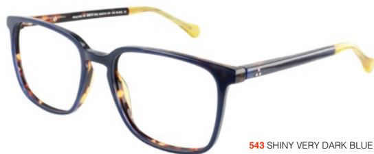
543 SHINY VERY DARK BLUE