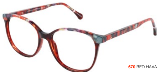
670 RED HAVANA