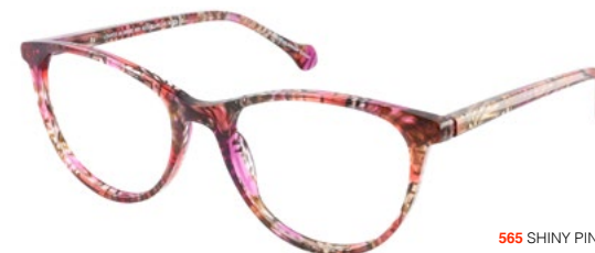
565 SHINY PINK