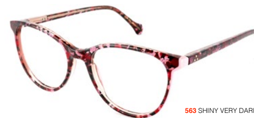
563 SHINY VERY DARK PINK