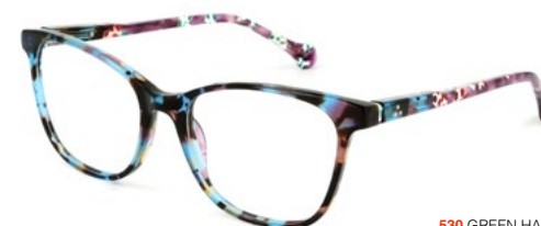
530 GREEN HAVANA