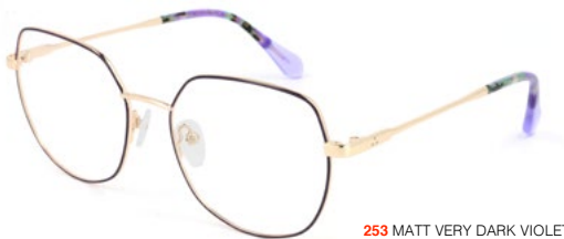
253 MATT VERY DARK VIOLET