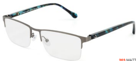
203 MATT GUN