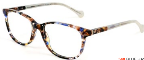
540 BLUE HAVANA