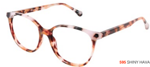
595 SHINY HAVANA