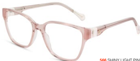
566 SHINY LIGHT PINK