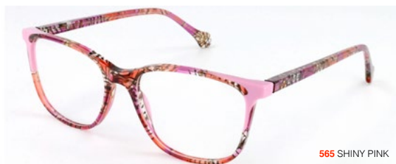
565 SHINY PINK