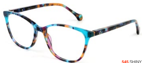
545 SHINY BLUE