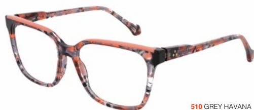
510 GREY HAVANA