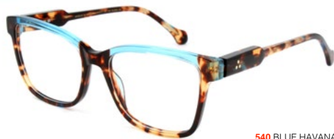
540 BLUE HAVANA