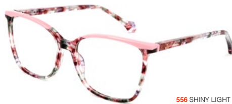
556 SHINY LIGHT VIOLET