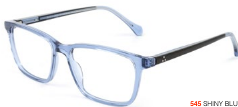
545 SHINY BLUE