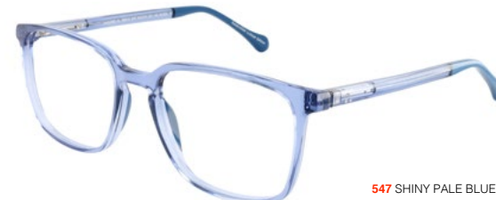
547 SHINY PALE BLUE