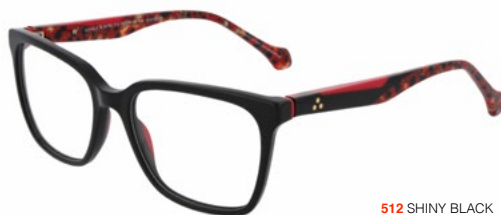
512 SHINY BLACK