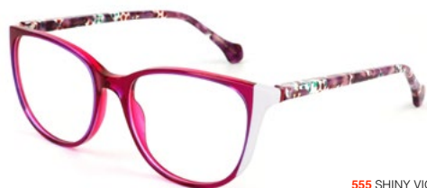
555 SHINY VIOLET