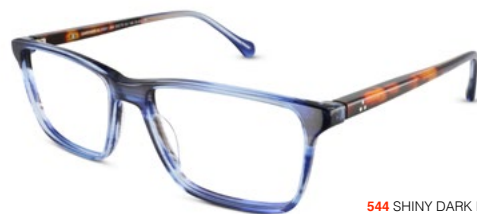
544 SHINY DARK BLUE