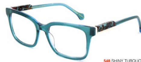
548 SHINY TURQUOISE