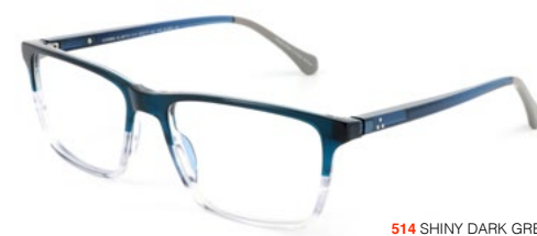
514 SHINY DARK GREY