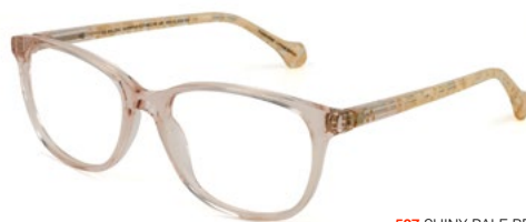
527 SHINY PALE BROWN