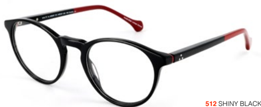
512 SHINY BLACK