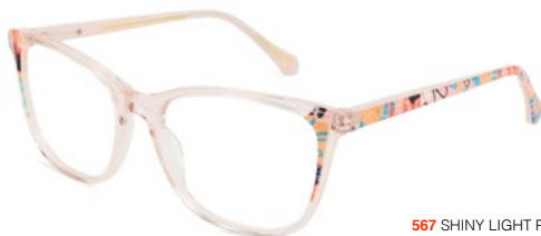
567 SHINY LIGHT PINK