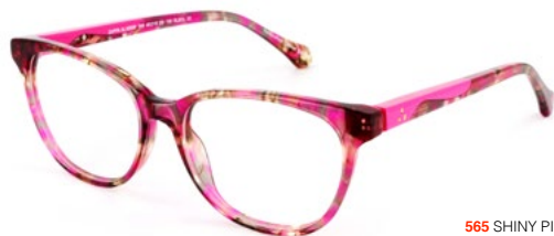
565 SHINY PINK