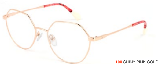
100 SHINY PINK GOLD