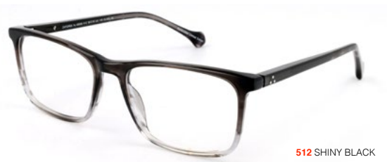
512 SHINY BLACK