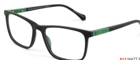
612 MATT BLACK