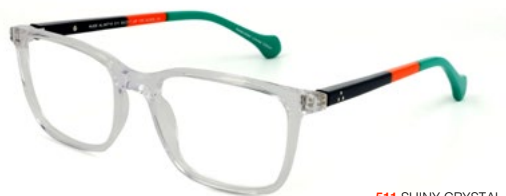
511 SHINY CRYSTAL