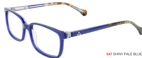
547 SHINY PALE BLUE