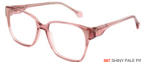
567 SHINY PALE PINK