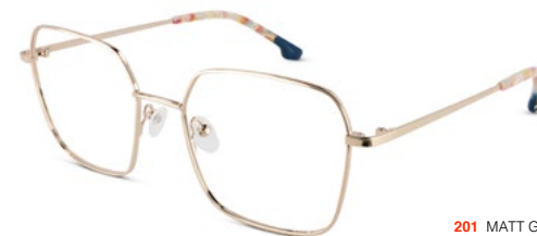
201 MATT GOLD