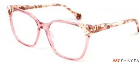
567 SHINY PALE PINK