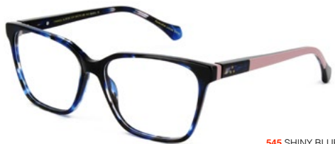
545 SHINY BLUE