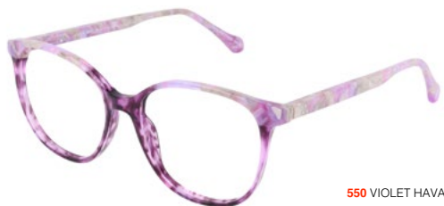
550 VIOLET HAVANA