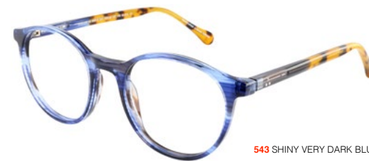
543 SHINY VERY DARK BLUE