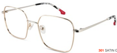
301 SATIN GOLD