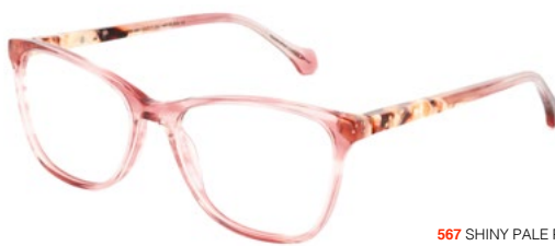
567 SHINY PALE PINK