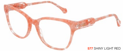
577 SHINY LIGHT RED