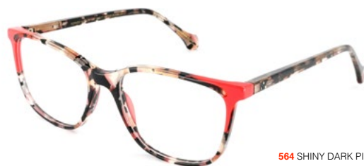
564 SHINY DARK PINK