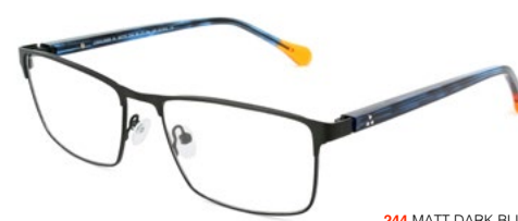
244 MATT DARK BLUE