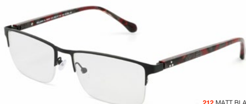
212 MATT BLACK