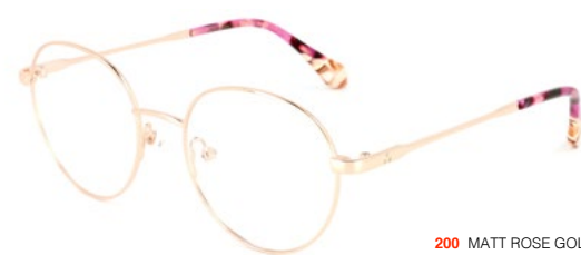
200 MATT ROSE GOLD