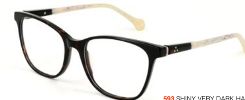
593 SHINY VERY DARK HAVANA