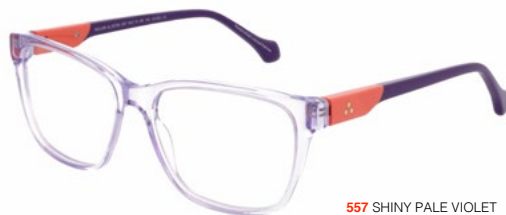
557 SHINY PALE VIOLET