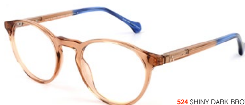
524 SHINY DARK BROWN