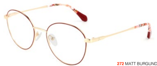
272 MATT BURGUNDY