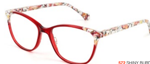
572 SHINY BURDEAUX