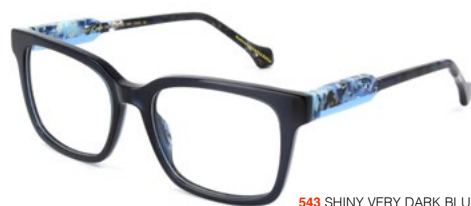
543 SHINY VERY DARK BLUE