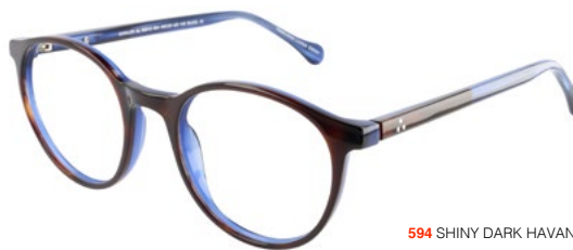
594 SHINY DARK HAVANA