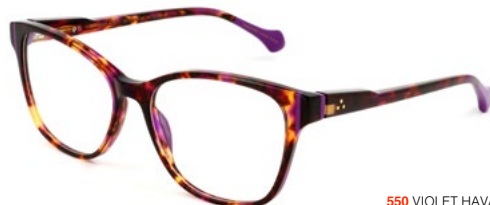
550 VIOLET HAVANA