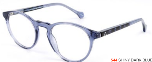
544 SHINY DARK BLUE