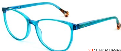
531 SHINY AQUAMARINE