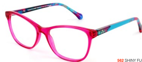
562 SHINY FUCSIA