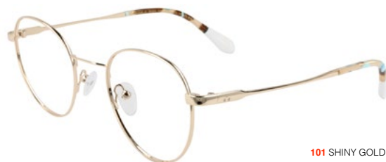
101 SHINY GOLD