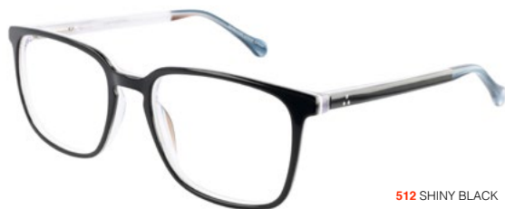
512 SHINY BLACK