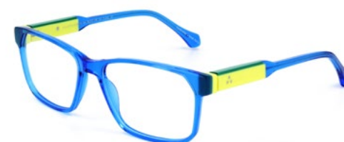
541 SHINY ELECTRIC BLUE