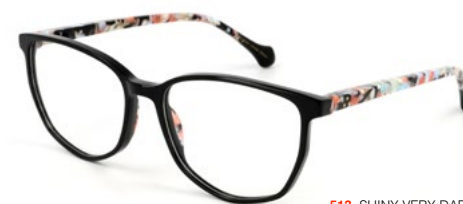
513 SHINY VERY DARK GREY