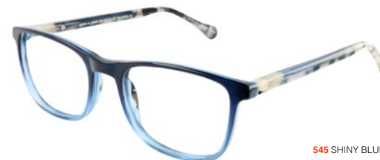
545 SHINY BLUE