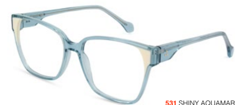
531 SHINY AQUAMARINE