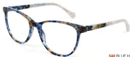
540 BLUE HAVANA