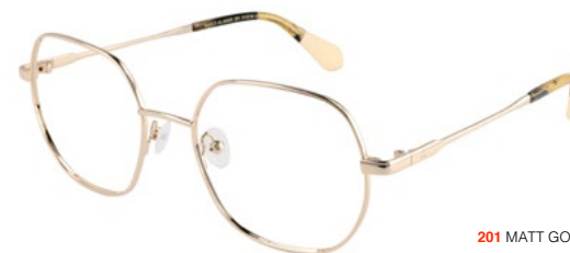
201 MATT GOLD