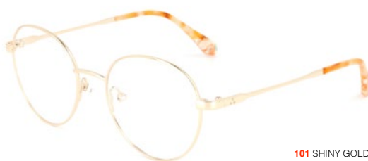
101 SHINY GOLD