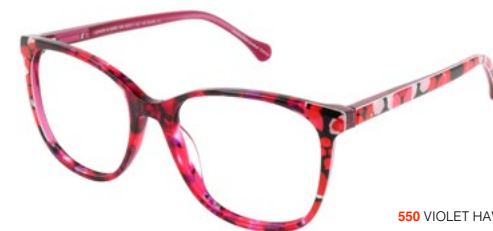
550 VIOLET HAVANA