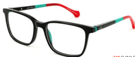
512 SHINY BLACK