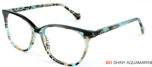
531 SHINY AQUAMARINE