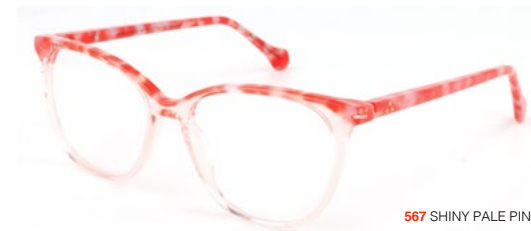
567 SHINY PALE PINK