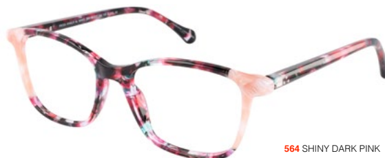
564 SHINY DARK PINK