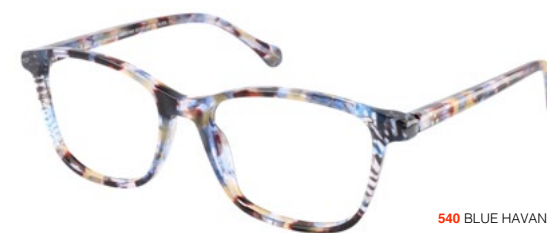
540 BLUE HAVANA