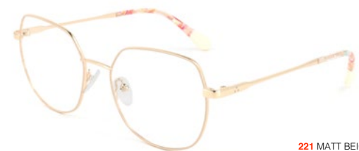
221 MATT BEIGE