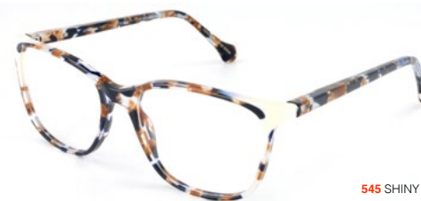
545 SHINY BLUE