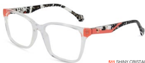
511 SHINY CRISTAL