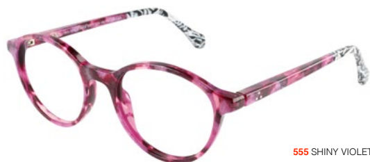
555 SHINY VIOLET