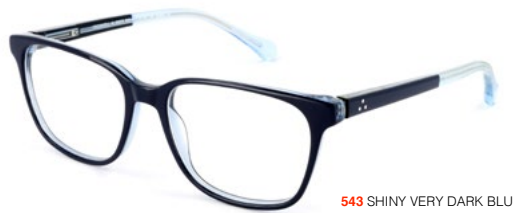
543 SHINY VERY DARK BLUE