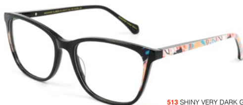
513 SHINY VERY DARK GREY