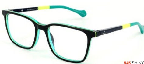
545 SHINY BLUE