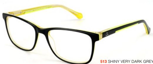
513 SHINY VERY DARK GREY