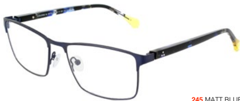
245 MATT BLUE