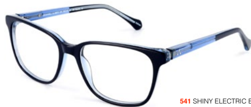
541 SHINY ELECTRIC BLUE