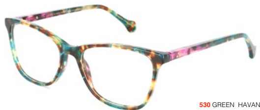
530 GREEN HAVANA