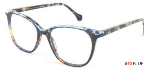
540 BLUE HAVANA