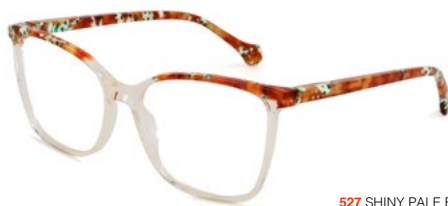
527 SHINY PALE BROWN