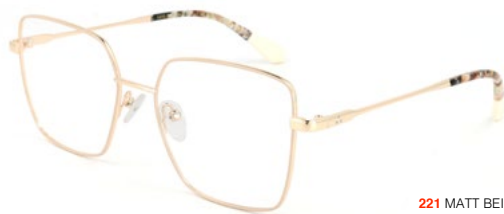
221 MATT BEIGE