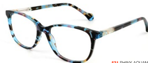
531 SHINY AQUAMARINE