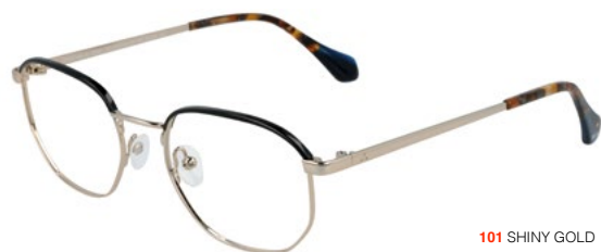
101 SHINY GOLD