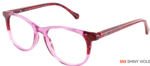
555 SHINY VIOLET