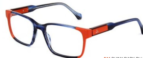
544 SHINY DARK BLUE