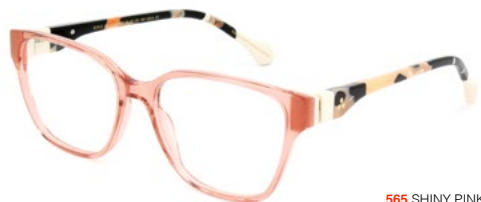
565 SHINY PINK