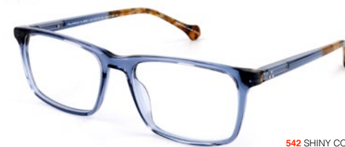
542 SHINY COBALT