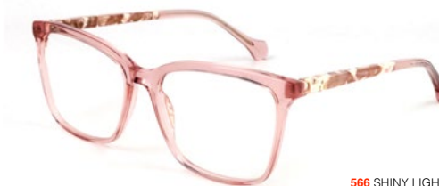
566 SHINY LIGHT PINK