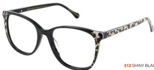
512 SHINY BLACK