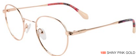
100 SHINY PINK GOLD