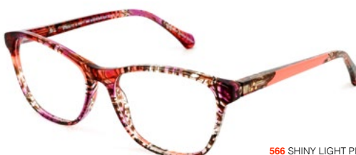
566 SHINY LIGHT PINK