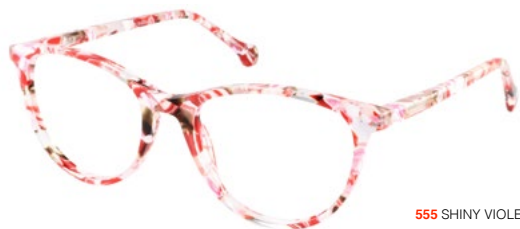
555 SHINY VIOLET