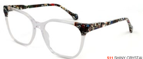
511 SHINY CRYSTAL