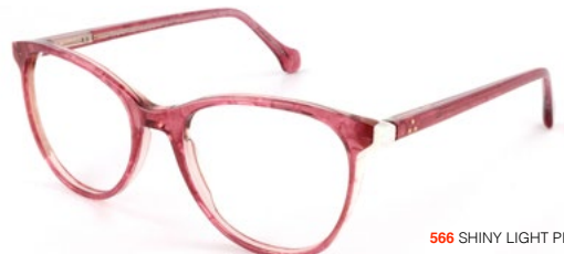
566 SHINY LIGHT PINK