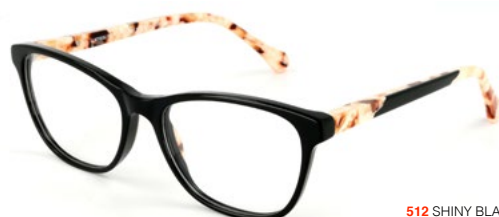
512 SHINY BLACK