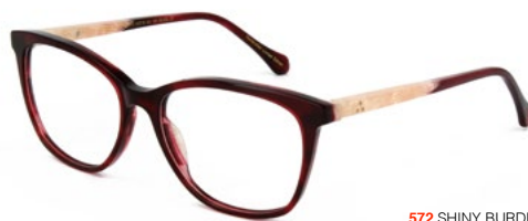
572 SHINY BURDEAUX