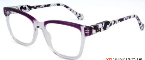
511 SHINY CRYSTAL