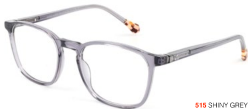
515 SHINY GREY