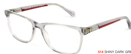
514 SHINY DARK GREY