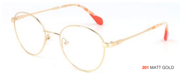
201 MATT GOLD