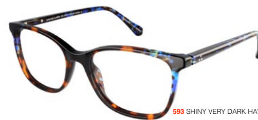
593 SHINY VERY DARK HAVANA