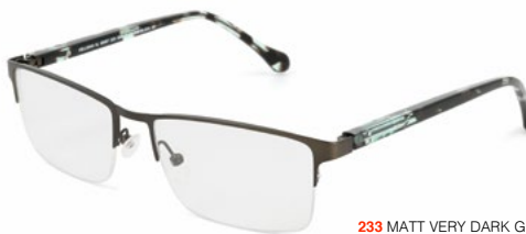
233 MATT VERY DARK GREEN