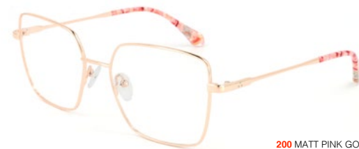
200 MATT PINK GOLD