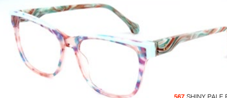
567 SHINY PALE PINK