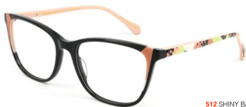
512 SHINY BACK