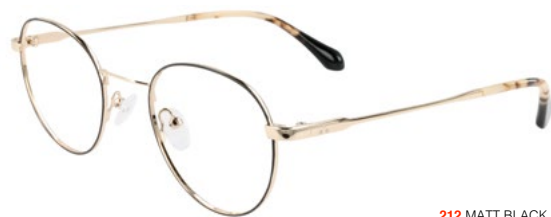
212 MATT BLACK