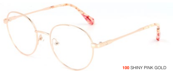
100 SHINY PINK GOLD