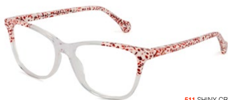
511 SHINY CRYSTAL