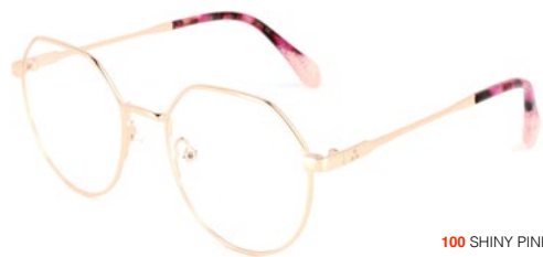
100 SHINY PINK GOLD