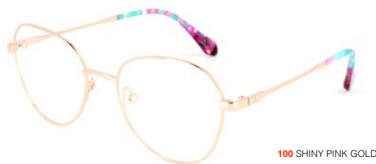
100 SHINY PINK GOLD