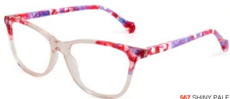
567 SHINY PALE PINK