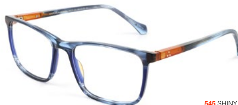
545 SHINY BLUE