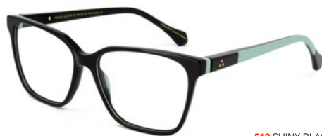
512 SHINY BLACK