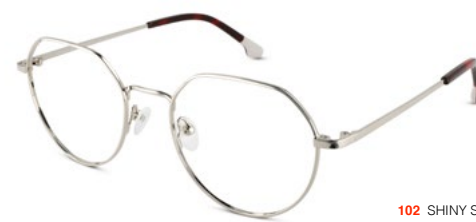
102 SHINY SILVER