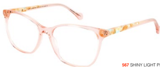
567 SHINY LIGHT PINK