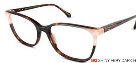
593 SHINY VERY DARK HAVANA