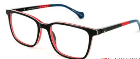
543 SHINY VERY DARK BLUE