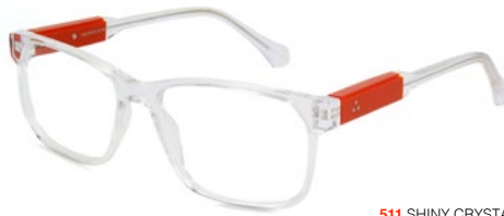
511 SHINY CRYSTAL