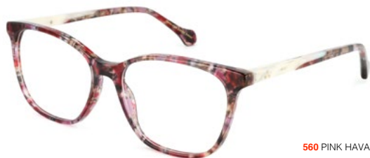
560 PINK HAVANA