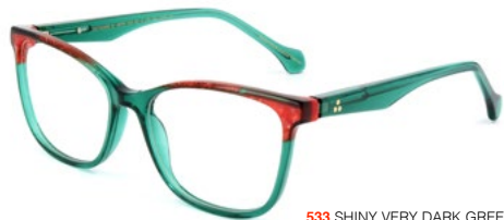
533 SHINY VERY DARK GREEN