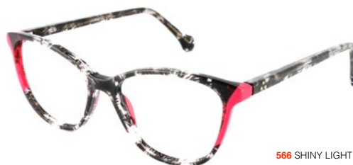
566 SHINY LIGHT PINK