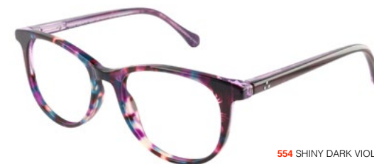
554 SHINY DARK VIOLET