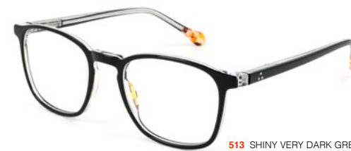
513 SHINY VERY DARK GREY