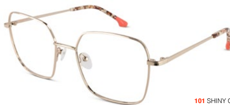
101 SHINY GOLD