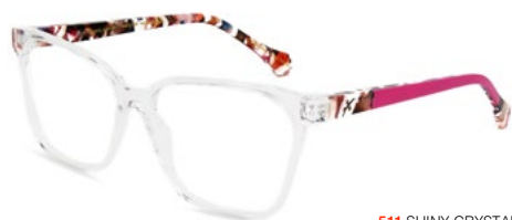
511 SHINY CRYSTAL