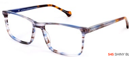
545 SHINY BLUE