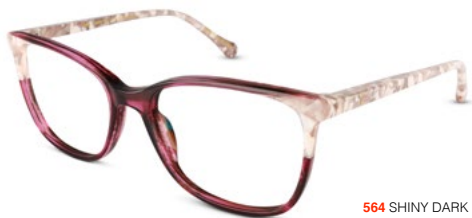
564 SHINY DARK PINK