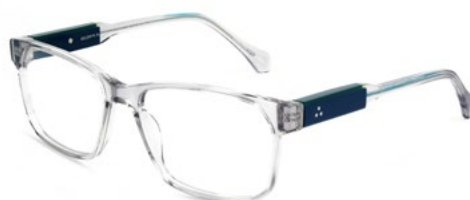
515 SHINY GREY