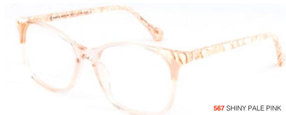
567 SHINY PALE PINK