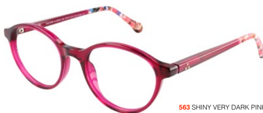
563 SHINY VERY DARK PINK