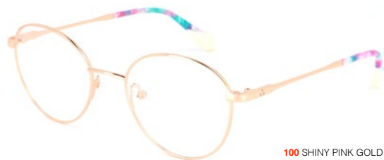
100 SHINY PINK GOLD