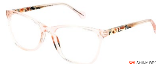
525 SHINY BROWN