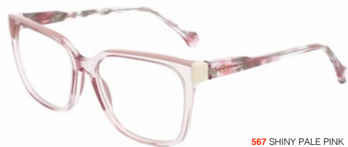
567 SHINY PALE PINK