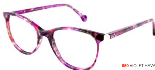
550 VIOLET HAVANA