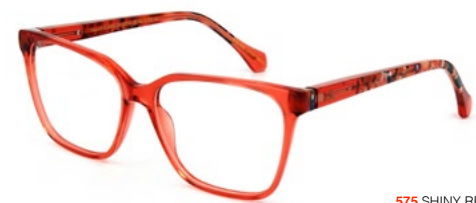
575 SHINY RED