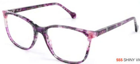
555 SHINY VIOLET