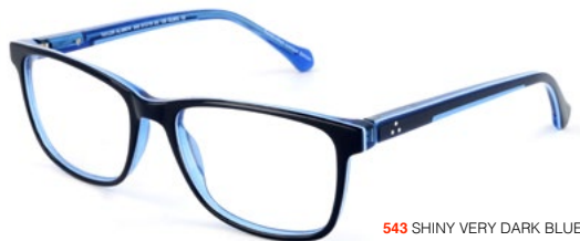
543 SHINY VERY DARK BLUE