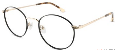
212 MATT BACK