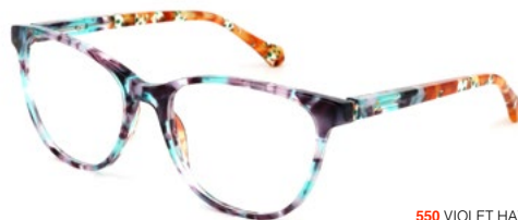
550 VIOLET HAVANA