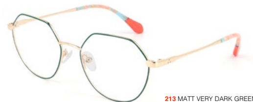
213 MATT VERY DARK GREEN