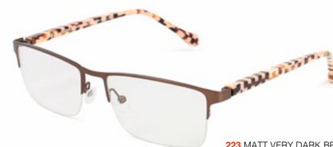
223 MATT VERY DARK BROWN