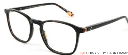
593 SHINY VERY DARK HAVANA