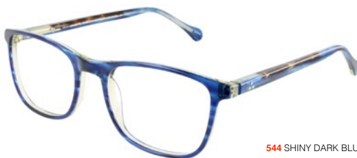
544 SHINY DARK BLUE