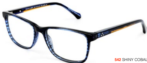
542 SHINY COBALT