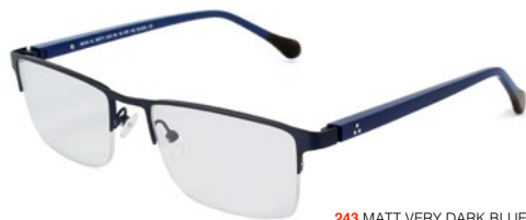
243 MATT VERY DARK BLUE