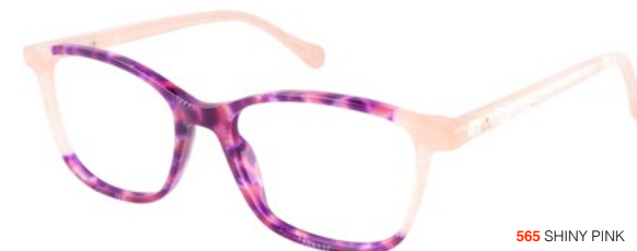
565 SHINY PINK