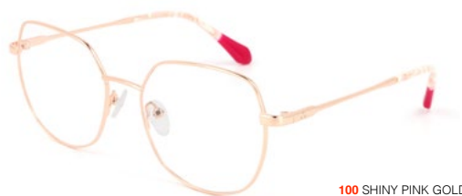
100 SHINY PINK GOLD