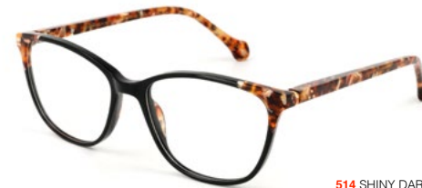
514 SHINY DARK GREY