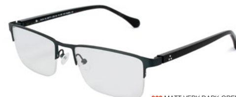
233 MATT VERY DARK GREEN