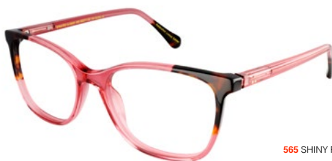
565 SHINY PINK