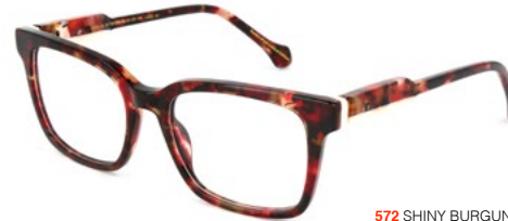
572 SHINY BURGUNDY