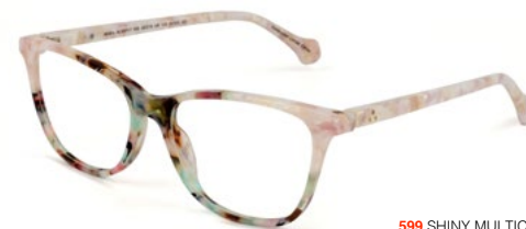
599 SHINY MULTICOLOR