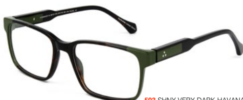
593 SHINY VERY DARK HAVANA