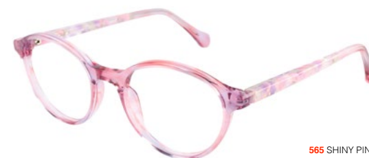
565 SHINY PINK