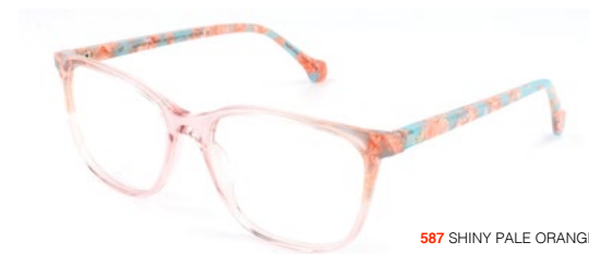
587 SHINY PALE ORANGE