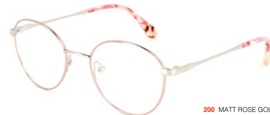
200 MATT ROSE GOLD