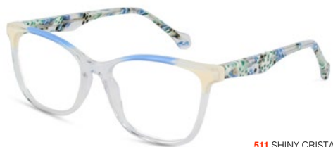
511 SHINY CRISTAL