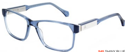
545 SHINY BLUE