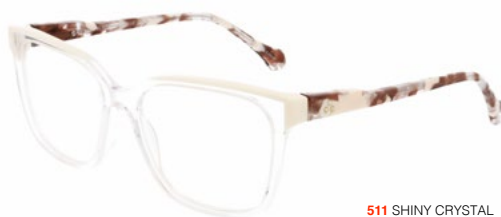
511 SHINY CRYSTAL