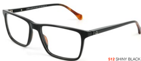
512 SHINY BLACK