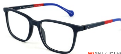
643 MATT VERY DARK BLUE