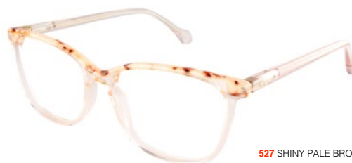
527 SHINY PALE BROWN