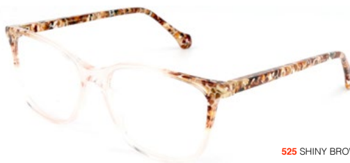
525 SHINY BROWN