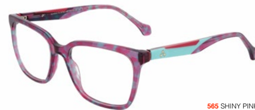
565 SHINY PINK