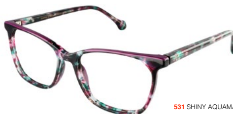
531 SHINY AQUAMARINE