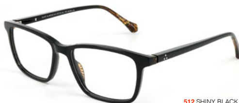
512 SHINY BLACK