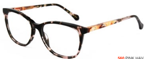
560 PINK HAVANA